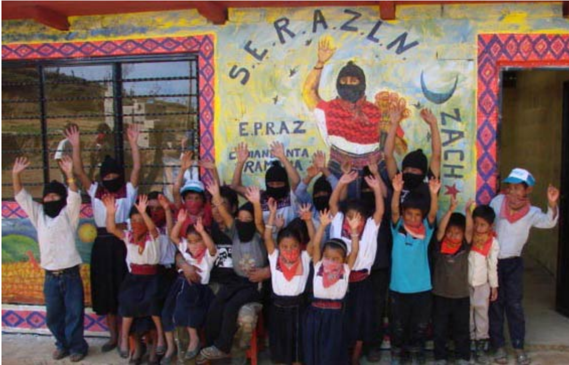
Zapatista kinderen voor een school gebouwd door 'Schools for Chiapas'. (Modelo Educativo Zapatista Destaca a Nivel Internacional, 2012)

Het autonome onderwijssysteem omvat onderwijsbegeleiders en een basisschool in elk dorp, en in sommige gevallen een lokaal comité om het onderwijs te bevorderen. Elke commune is verantwoordelijk voor het bouwen van een school en voor het bieden van economische ondersteuning aan de onderwijsbegeleiders. Een Onderwijscommissie coördineert het werk in elke autonome gemeente. Naast de lokale basisscholen zijn er nu ook een aantal regionale middelbare scholen die fungeren als kostscholen voor kinderen uit de omliggende dorpen. Voor deze regionale middelbare scholen werden opgericht, was het zeldzaam dat inheemse kinderen verder opgeleid werden na de basisschool (Klein, 2015).