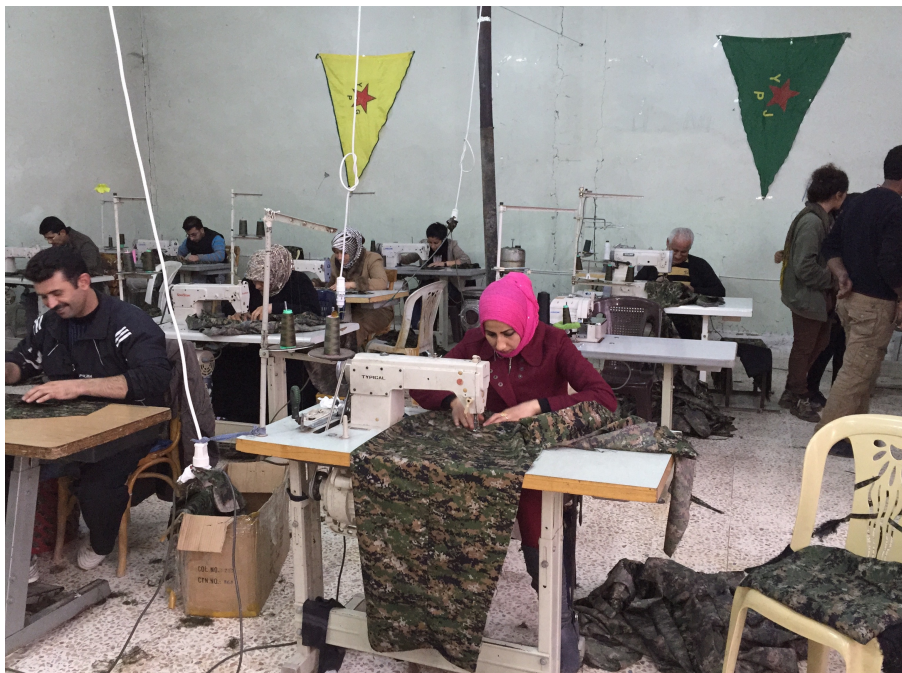
Leden van een naaicoöperatief in Rojava. (Isik, 2016)

Ondanks de burgeroorlog en het economische embargo van Turkije en van de nabije Syrische lokale overheden is Rojava heel productief. Het model van Rojava voor haar eigen economie is een gemengde economie met sterke sociale diensten en met gemeenschapscoöperatieven als dominante vorm van bedrijfsvoering (De Jong, 2016). Het economische plan van de Rojava-revolutie wordt ' People's Economy ' genoemd (Strangers in a Tangled Wilderness, 2014).