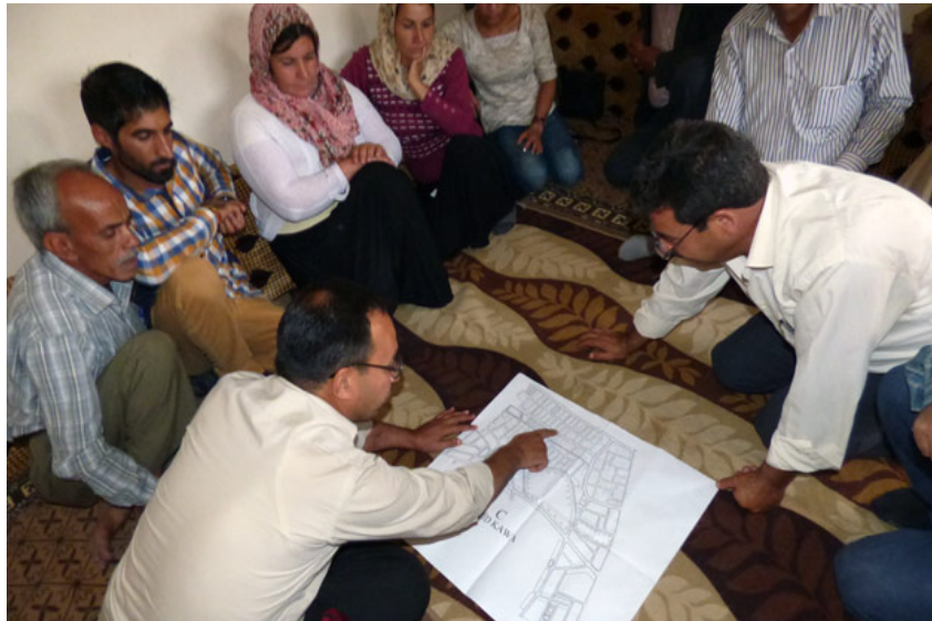
Vergadering van de gemeente Şehîd Kawa C raad om mogelijke nieuwe grenzen te bepalen (The Collective, 2016).

gemeenteraden vallen, wordt de kwestie doorverwezen naar de wijkraad (Knapp, Flach, & Ayboga, 2016).