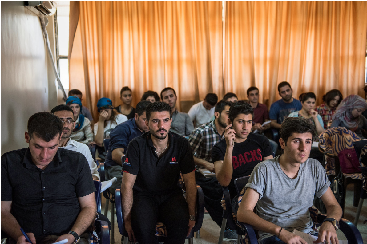
Studenten volgen les in de Mesopotamian Academy of Social Sciences in Qamishlo . (Enzinnanov, 2015)

In september 2014 opende de eerste universiteit 5 van Rojava zijn deuren. De Mesopotamian Academy of Social Sciences , in Qamishlo, is de eerste universiteit waar les gegeven wordt in de Koerdische taal. Vóór de revolutie, onder de assimilatiepolitiek en Arabisering van de Syrische staat, werd het de Koerden verboden om hun eigen taal te spreken, hun kinderen Koerdische namen te geven, winkels te openen met niet-Arabisch namen, Koerdische scholen op te richten en Koerdische boeken en geschriften te publiceren. De oprichting van een universiteit waar de lessen in het Koerdisch gegeven worden is een belangrijke ontwikkeling die niet mag onderschat worden. De universiteit ligt in de stad Qamishlo in het Cizire kanton en heeft drie afdelingen: rechten, sociologie en geschiedenis (First New University To Open In Rojava, 2014).