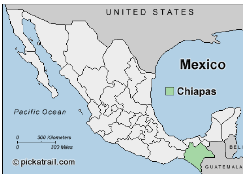
Chiapas (Forbis, 2014)

Chiapas is de meest zuidelijke deelstaat van Mexico en grenst met haar oostelijke grens aan Guatemala. In het westen en het noorden van de deelstaat liggen de deelstaten Oaxaca, Veracruz en Tabasco. Ten zuiden van Chiapas ligt de Grote Oceaan. De bergachtige deelstaat heeft een oppervlakte van 73.724 km 2 en telt ongeveer 5,2 miljoen inwoners (Información Por Entidad, 2015). Chiapas maakt pas sinds 1824 officieel deel uit van de staat Mexico – de deelstaat behoorde oorspronkelijk tot het grondgebied van Guatemala en werd kort na de onafhankelijkheid van Mexico geannexeerd om de commerciële belangen van de bedrijfselites van Mexico te vrijwaren. Vandaag maakt de staat een belangrijk deel uit van de zeer gediversifieerde Mexicaanse identiteit. In het oosten van Chiapas ligt de uitgestrekte Lacandón Jungle, de thuisbasis van het EZLN (Nations Encyclopedia , 2004).