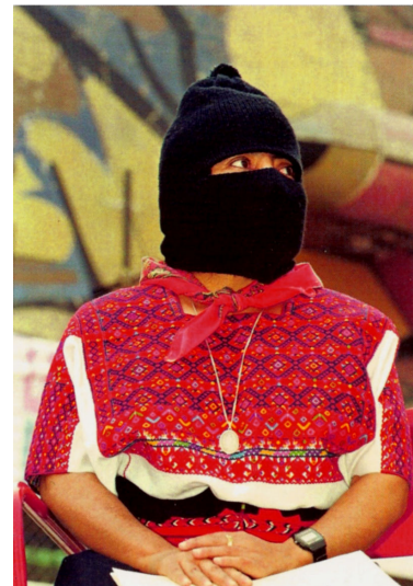
Comandanta Ramona