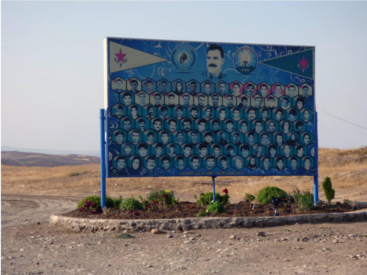
Poster van martelaren op de weg van Qamishlo naar Kobani met een foto van Abdullah Öcalan aan de top (The Collective, 2016).

Öcalan stond boven iedereen in de positie van rechtmatige, onfeilbare en onaantastbare rechter. De PKK-leider heeft vaak kritiek gegeven op activisten die zich in het begin van de jaren negentig bij de partij voegden. Vele van die leden kwamen uit universiteiten en scholen die volgens Öcalan door de bourgeoisie vergiftigd waren; 'ware' intellectuelen waren echter enkel zij die onvoorwaardelijke Abdullah Öcalan loofden. Hij heeft een onbetwiste monopolie over de definitie en interpretatie van de waarheid en van de 'realiteit' die Koerden ervaren. Enkel hij is –en niet 'heeft'- de sleutel tot bevrijding en bezit de mogelijkheid om elke persoon te beoordelen in hun wording tot een 'Nieuwe Mens' (Grojean, 2014).