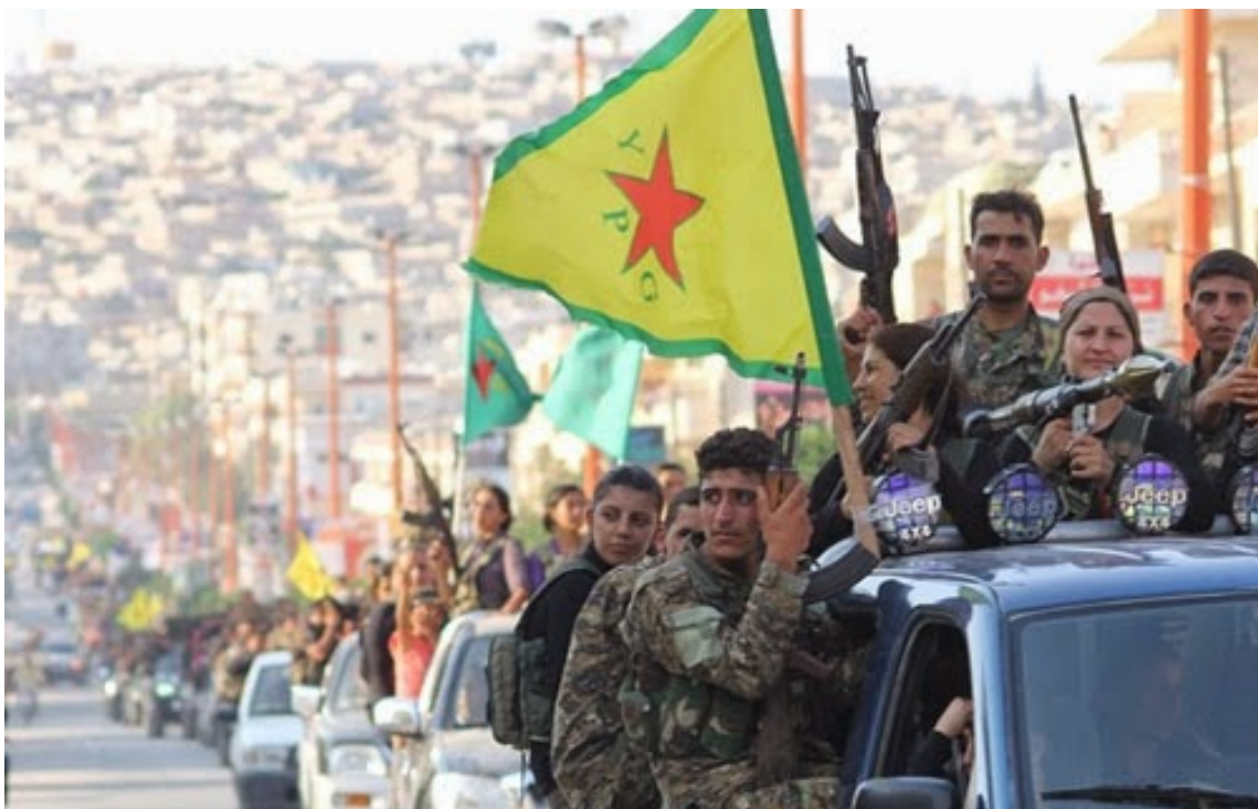
Een konvoi van zowel mannelijke als vrouwelijke Koerdische revolutionaire strijders uit de YPG.

De belangrijkste externe vechtmacht van Rojava tegen bedreigingen van buitenaf zijn de vrijwilligerslegers YPG en YPJ (Yekîneyên Parastina Jinê, ofwel de Vrouwelijke Volksbeschermingseenheden) De YPG is de strijdmacht van zowel vrouwen als mannen; de YPJ bestaat enkel uit vrouwen. Samen zijn ze goed voor 40.000 vechters, waarvan ongeveer 15.000 (ongeveer 35 procent) vrouwen. De meeste wapens zijn lichte vuurwapens gecombineerd met lichtgewicht raketwerpers. Tevens beschikken de strijders over ongeveer 40 zware vrachtwagens die zijn omgebouwd voor gepantserd personeelsvervoer (Dirik, 2014; Strangers in a Tangled Wilderness, 2014).