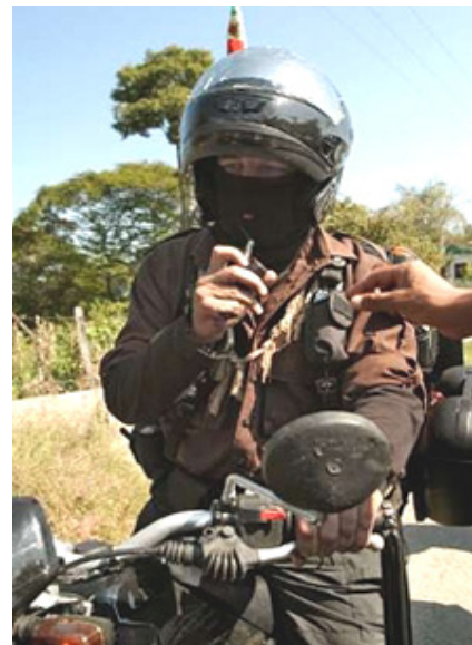
Subcomandante Marcos rust op zijn motorfiets op 1 januari 2006 bij de start van The Other Campaign (Bloomberg, 2006).

Om het politieke project van de Zapatistas te concretiseren organiseerde Marcos "The Other Campaign". Deze verliep parallel met de Mexicaanse verkiezingen van 2006 en beoogde een nieuwe vorm van politiek die, los van het formele politieke systeem, van de basis uit georganiseerd werd. Het begin van de campagne, precies 12 jaar na de opstand, huldigde Marcos in door het opstarten van een oude motorfiets: een verwijzing naar Che Guevara en zijn Zuid-Amerikaanse roadtrip. Zes maanden lang toerden delegaties van de Zapatistas door het hele land en ontmoetten linkse politieke organisaties, landloze boeren, families van vermoorde vrouwen en andere groepen en gemeenschappen waarmee ze eerder nooit in contact gekomen waren (Khasnabish, 2010). Het doel van deze tour was om een beter begrip op te bouwen van wat een alternatieve vorm van politiek voeren zou inhouden en om contacten te