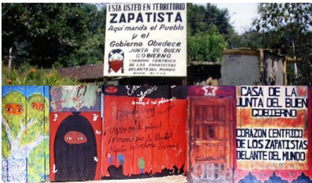
De Caracol van Oventik (Caracoles y Juntas de Buen Gobierno, n.d.).