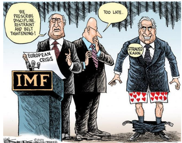
'USA to DSK: WHOOPSIE!' (Leisure, 2011)