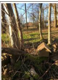
Tussen de bomen