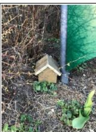
Aan de vuilnisbak (reversmentemal)