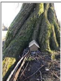
Aan de lotjesboom