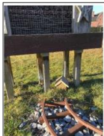
Aan het insectenhotel