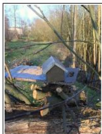
Aan de kring