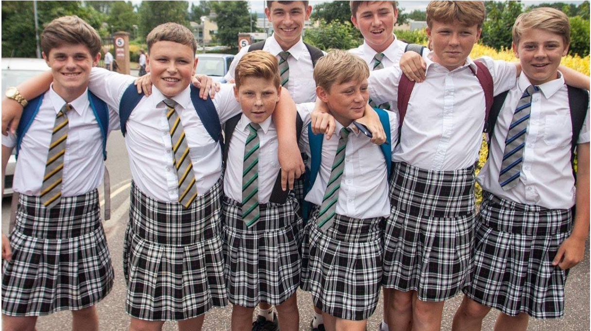
Leerlingen van de Isca Academ in Devon