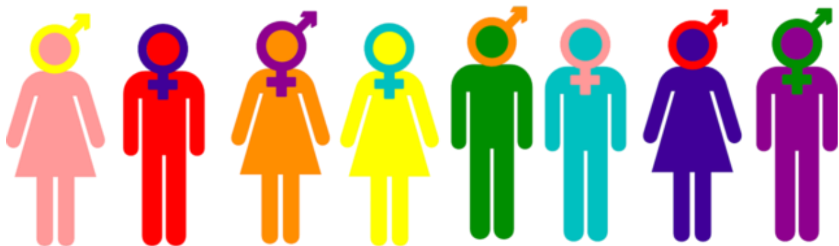
Gender en sekse door elkaar gemengd.