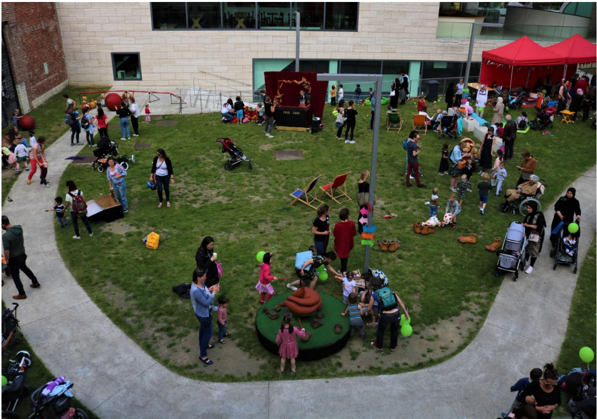
Gezinsfeest in Leuven.

Toch zijn er ouders die wel begrip tonen voor moeders en vaders die hun kinderen genderneutraal grootbrengen. Beluister hier een progressieve voxpop. Aan het woord zijn ouders op het jaarlijkse Gezinsfeest van Huis van het Kind in Leuven.