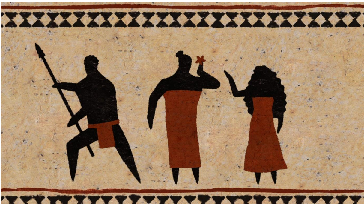
Māhū © The Origin of Gender

Het eerder aangehaalde YouTube-filmpje 'Origin of Gender' (2018) vertelt over de Māhū, een Hawaïaans volk dat een goed voorbeeld is van het standpunt gender en sekse niet aan elkaar te koppelen. De Māhū neemt namelijk een derde gender aan door zijn vrouwelijke én mannelijke eigenschappen te omarmen, ongeacht de sekse waartoe men behoort. Uit het informatief YouTube-filmpje 'The Meaning of Mahu' (2015) blijkt dat de Māhū al voor de kolonisatie bestond en dat ze nu nog steeds bestaan.