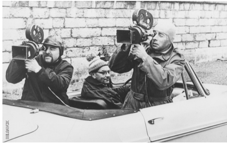
Tot aan de laatste bioscoopproductie gebruikte Belgavox filmtoestellen uit bouwjaar 1938. Hetzelfde materiaal waarmee de Nazi's hun oorlogspropaganda filmde aan het front.

»Versta me niet verkeerd, we gaven nog altijd zo goed mogelijk de werkelijkheid weer. Maar we probeerden wel bewust het goede uit het nieuws te halen. Neem bijvoorbeeld de brand in de Innovation ( brand in Brussels warehouse in 1967 waarbij meer dan 250 doden vielen, red. ). In plaats van ons te focussen op het bedroevend hoge aantal slachtoffers, zetten wij met Belgavox het fantastische werk van de brandweer in de verf. Met die aanpak hebben we volgens mij ook nooit ingeboet aan objectiviteit. Integendeel, ik denk dat we in die tijd objectiever konden zijn dan media nu. Door de nieuwe detaxatiewet was er minder commerciële druk en van politieke correctheid was nog geen sprake. Wel werd er rond die tijd een redactiecomité aangesteld om