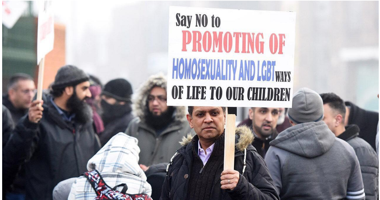
Birmingham, Groot-Brittannië 7 maart 2019 1