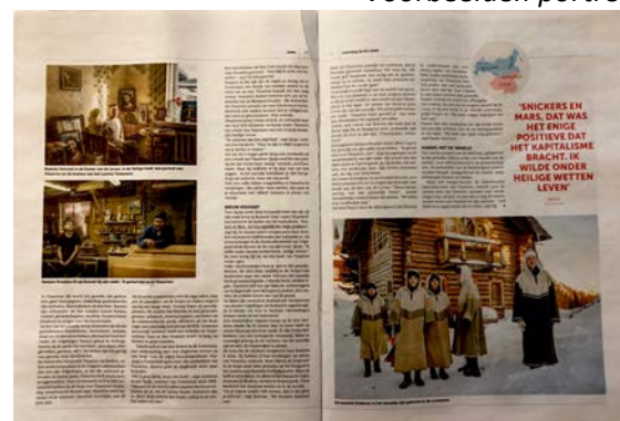
Voorbeeld achtergrondstuk (onvolledig)