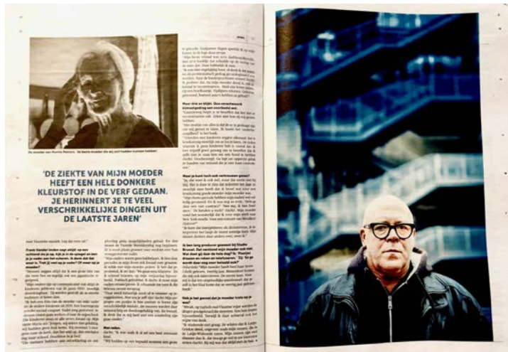
Voorbeeld onderdeel 'boeken.'