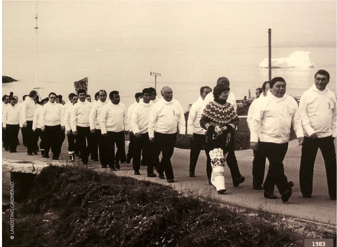
Officiële parlamentsfoto na het exit-referendum in 1982. Helemaal vooraan lopen voorzitter Lars-Emil Johansen (links) en premier Jonathan Motzfeldt.

zo'n 70% van de kiezers zorgt ervoor dat Groenland een heel resem aan bevoegdheden mee naar huis mag nemen, waaronder visserij dat geldt als 's lands belangrijkste economische drijfkracht. Maar vooral en bovenal: de bevolking heeft voortaan een eigen parlement en regering. Ex-premier en nationaal boegbeeld Lars-Emil Johansen (72) was de man van het eerste uur. Als lid van een bijzondere commissie in Denemarken had hij het referendum over zelfbestuur mee mogelijk gemaakt. Na de overwinning keert hij terug naar zijn thuisland waar hij wordt benoemd tot minister voor Visserij in de allereerste Groenlandse regering. "Onze roep om zelfbeschikking was onlosmakelijk verbonden met de wens om opnieuw uit de Europese Gemeenschap te stappen, en met het idee in ons achterhoofd dat we Groenland op een dag volledige onafhankelijkheid zouden kunnen schenken. We zijn dan ook meteen na de verkie-