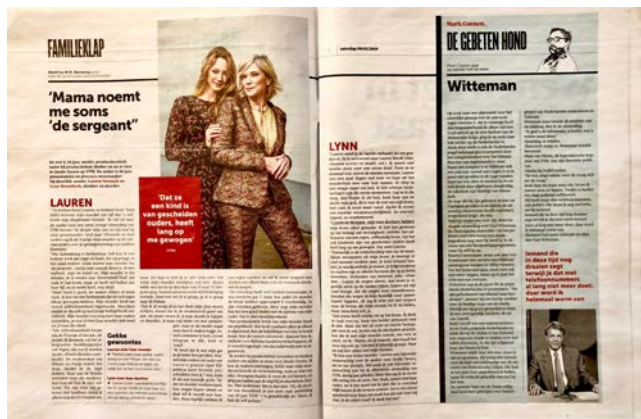
Voorbeeld rubriek (links) en column (rechts)

De columns onderscheiden zich dan weer van de rubrieken door middel van een lichtblauwe achtergrond, en bovenaan de tekst staat een illustratie van het gelaat van de columnist in kwestie. Tot slot is het kleurgebruik anders bij het onderdeel 'boeken'. Hier zijn de quotes blauw in plaats van rood, en voor de foto's maakt men gebruik van koelere tinten met een dramatische ondertoon.