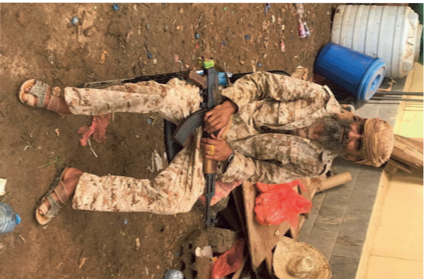
Bewaker van de kazerne.

Tien dagen later, nog steeds in Jemen, keer ik elke nacht terug naar de kazerne aan de Rode Zee. In dit land ben ik niet de enige met vreemde dromen. Dat blijkt als ik onderweg naar San'a word overgegragen aan een mevrouw fixer, tevens ambtenaar in de roebelontgeving. Terwijl de auto voortbreegt door de duistert hooganden, maakt hij een grapje. "Ik zoek een tweede vrouw. Ik heb een droom gehad. Dat zij Europese is." Schalks-