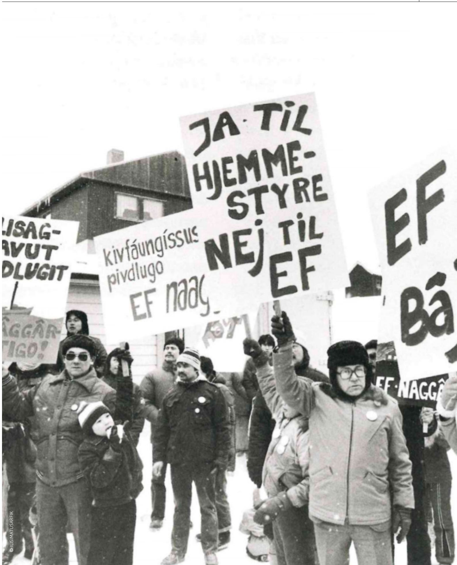
Betoging tegen Europees lidmaatschap, 1982.