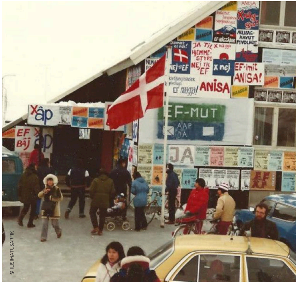
Hoofdstad Nuuk in aanloop naar het exit-referendum.

De landen zelf staan eveneens mijlenver uit elkaar. Groenland mag qua oppervlakte dan wel negen keer zo groot zijn als het Verenigd Koninkrijk, qua bevolkingsaantal komen ze niet verder dan pakweg het Vlaamse Roeselare. Ook op economisch vlak is het niet meer dan een kleine garnaal naast het Verenigd Koninkrijk, dat zich laat gelden als een van de belangrijkste motoren van de Europese Unie. En dan is er nog de uitstapprocedure. "In de jaren 80 bestond dat beruchte Artikel 50 (dat een kader schept voor het vertrek van een EU-lidstaat, nvdr.) nog niet," aldus Vos, "maar dat was ook niet nodig aangezien Groenland deel uitmaakt van het Koninkrijk Denemarken. Het was met andere woorden geen volledige lidstaat, maar een deel