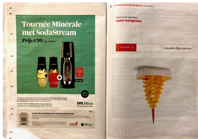
Links: laatste bladzijde Zeno. Rechts: laatste bladzijde vacature.com

Dat is het einde van Zeno , maar niet het einde van de bijlage. Er is namelijk nog een bundel van vacature.com aangehecht, maar de pagina's staan ondersteboven. Als je Zeno met andere woorden op z'n kop draait en begint bij de allerlaatste pagina, dan lees je eigenlijk een bijlage van vacature.com . Deze bundel opent met een viertal artikels die op een of andere manier te maken hebben met werk, gevolgd door een hele reeks vacatures.