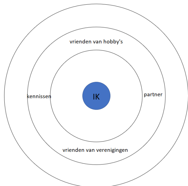
Figuur 2: Het middelste hoofdstuk van Ivonne

Daarnaast gaven de meeste geïnterviewden ook aan dat het sociale netwerk veranderde door op pensioen te gaan. Het contact met collega's van op het vroegere werk nam af: