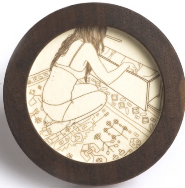
Afb. 13: Melanie Bilenker, Dresser Drawer , broche, 2010.