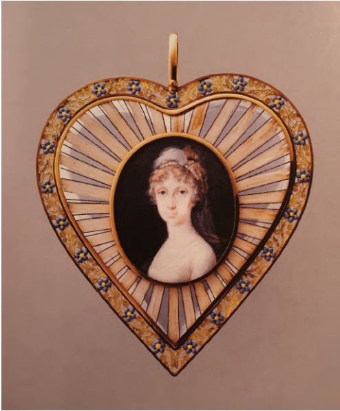
Afb. 7: Hartvormige hanger van prinses Marie-Amélie van Bourbon voor Louis-Philippe van Orléans, begin 19 de eeuw. Vergeet-me-nietjes omkransen het portret en de omringende stralen bevatten haren van de prinses.

stijlen werden in de juweelkunst naar hartenlust geherinterpreteerd 29 en natuurlijke motieven zoals bladranken, vlinders en bloemen met gevoelige betekenissen werden aan het decoratieve pallet toegevoegd (afb. 7 - 8). 30 In de tweede helft van de 19 de eeuw kende de romantiek haar einde en werden de dromerige sentimentele juwelen stilaan overschadwd door de