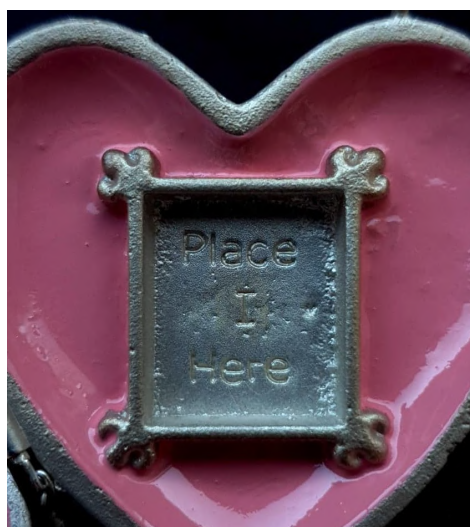
Afb. 27: "Place Photo Here".

"Ce cœur qui s'ouvre contient l'œil du Roi peint en miniature." Na het openen van het medaillon zag Charlotte het oog van haar vader koning Leopold I. Het oorspronkelijke Polley Pocket -medaillon bood het kind de mogelijkheid om zelf een beeld in het hart te steken. Zo instrueerde een lieflijk bebloemd kadertje: "Place