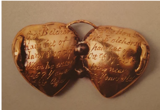
Afb. 4: Liefdes- en rouwjuweel in rococostijl, 18 de eeuw. Typische sentimentele elementen zijn de hartvorm, de haarlokken, de gravures en de initialen uit gouddraad.

luchthartige rococostijl het stilaan van de zware barok over. Allegorische putti, harten, duifjes, vlamtoortsen, asymmetrische krullen, strikken en geslepen kristal omkaderden het sentiment op zoete wijze, wat een miniatuurportret, een haarlok, een gegraveerde naam, datum of boodschap, of een combinatie van deze elementen kon zijn (afb. 4). 23