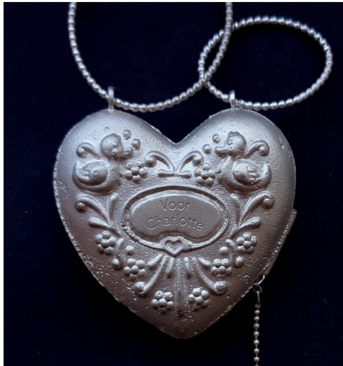
Afb. 28: Juweel N° 16, met op de achterkant de handgravure "Voor Charlotte".

Photo Here" (afb. 26). In het zilveren hart vaagde ik de "Photo" weg en kwam er een "I" in de plaats (afb. 27). "Place I Here" klinkt hetzelfde als "Place Eye Here". De "I" kan echter nog naar tal van andere dingen verwijzen – naar bijvoorbeeld leopold I, naar louise, of zelfs naar I, ik, de maker, die doorheen haar stukken misschien ook wel wat bestaansrecht wil opeisen. Wat voor spel speelt dit juweel? Of eerder, met wie speelt dit juweel een spel? De achterkant laat een duidelijke "Voor Charlotte" zien (afb. 28). Maar gaat dit om de Charlotte die haar moeder te vroeg verloor en in diens juweel het oog van vader leopold koestert, of gaat het om de Charlotte die met de jaren een diepgaande genegenheid ontwikkelde voor louise en eigenlijk ook een beetje wil meespelen?