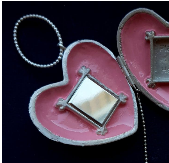
Afb. 29: Juweel N° 16, met een spiegeltje aan de linker binnenzijde.

Omdat het hart een oog hoorde te omsluiten – wiens oog laten we in het midden – was het verleidelijk om te spelen met hoe dat oog, of de blik, op de bekeken inwerkt. In het eerste hoofdstuk werd reeds duidelijk hoe het sensuele oogminiatuurjuweel indringend op de geliefde inwerkte en hoe het oog in de hedendaagse juweelwereld onder andere door Otto Künzli op eigenzinnige wijze werd geïnterpreteerd. Het gaat om kijken en bekeken worden, wat het oog tot medium van reflectie en zelfreflectie maakt. Zo bevat het medaillon aan de linker binnenzijde een klein zilveren, al even speels spiegeltje. Een spiegeltje dat elke nieuwsgierige indringer ogenblikkelijk in eigen boezem laat kijken (afb. 29).