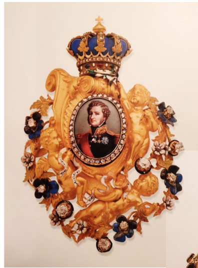
Afb. 8: Gouden broche met romantische florale decoraties, midden 19 de eeuw. Vooraan pronkt een portret van koning Louis-Philippe van Orléans en achteraan een portret van diens overleden zoon Ferdinand-Philippe.

nuchterheid van de opkomende industrialisatie. 31 Daarbij zorgde de opkomst van de fotografie voor een verminderde interesse in handgeschilderde portretjuwelen. 32 In 1861 verloor koningin Victoria bovendien zowel haar moeder als echtgenoot, en het verdriet was zo groot dat dit zelfs voor een massale snelproductie van makkelijk fabriceerbare rouwjuwelen zorgde. Jammer genoeg zorgde deze massaproductie rond het einde van de 19 de eeuw voor een teloorgang van de intimiteit van het sentimentele juweel, 33 de intimiteit die het juweel net zo overtuigend 'sentimenteel' maakte.