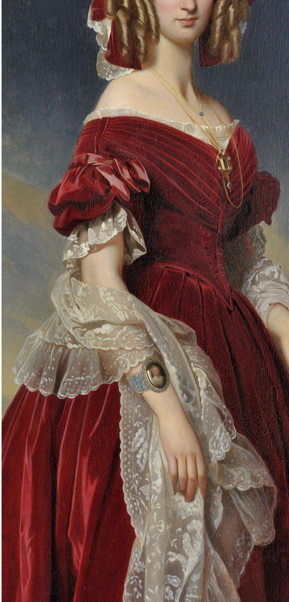
Afb. 19: Portret van Louise-Marie d'Orléans (detail), door Franz-Xaver Winterhalter, 1844-1845.