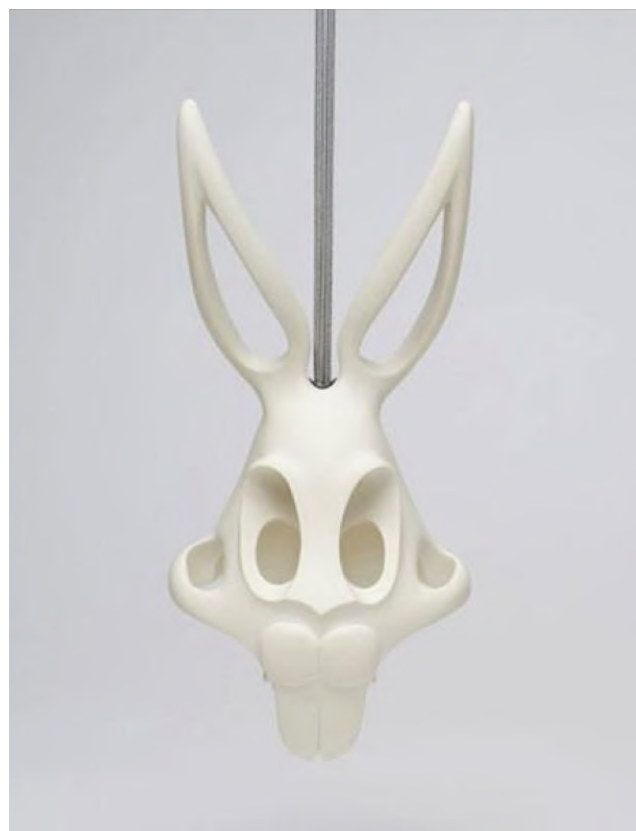
Afb. 10: Alexander Blank, schedel uit de Memento Juniori -serie (Bugs Bunny), hanger, 2011.