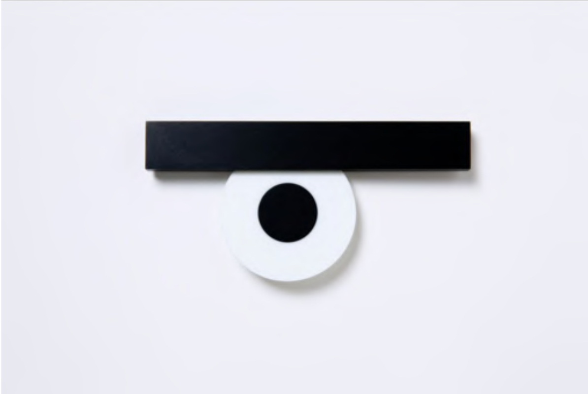
Afb. 17: Otto Künzli, Auge VII (onderdeel van de serie Augenblick ), broche, 2016.

Dit historisch overzicht laat zien hoe het sentimenteel juweel van de renaissance tot het begin van de industrialisatie – van begin 16 de eeuw tot eind 19 de eeuw – geliefden eerde, om doden rouwde, trouw aantoonde en momenten vierde. Zowel vormelijk als inhoudelijk blijft dit juweel tot de verbeelding spreken. Want zoals bleek, blijven ook hedendaagse makers graag spelen met zijn symboliek, intimiteit en mystieke geladenheid.