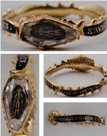
Afb. 3: Rouwring in rococostijl voor Edward Wigglesworth, 1794.

Deze gewoonte werd in het begin van de 18 de eeuw openlijker voortgezet, want de liefde voor het sentimentele nam toe. Ook al zegevierde de rede in de tijd van de Verlichting, in de filosofie en nadien ook in de literatuur zette het sentimentalisme zich door, een stroming die pleitte voor de waarde van de emotie en benadrukte dat er meer was dan enkel ratio. 21 Zo werden bovenvermelde symbolen die verwezen naar de dood nog steeds gebruikt, zoals te zien is aan een zwart geëmailleerde rouwring die de herinnering aan een zekere Edward Wigglesworth in leven houdt (afb. 3). 22 Wel nam een meer