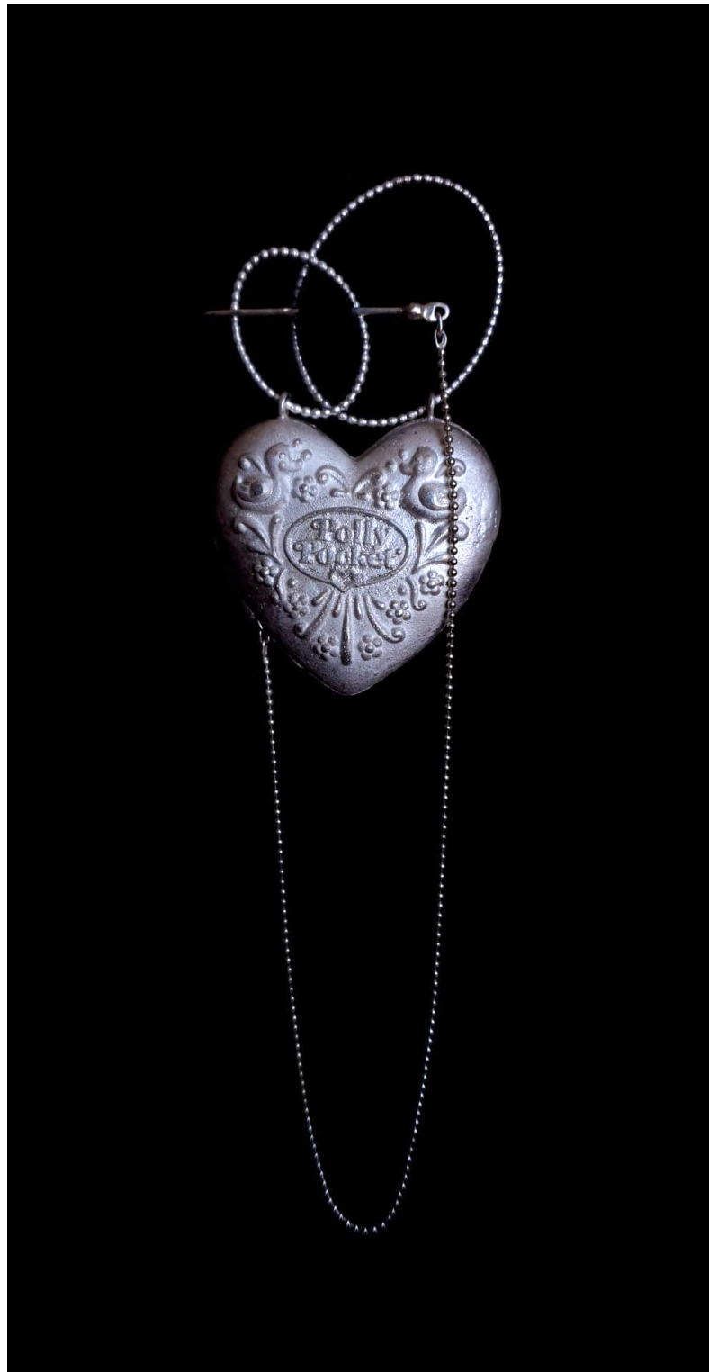
Afb. 23 (linksonder): Juweel N° 16, sterling zilver, roze koudemail, geopend.