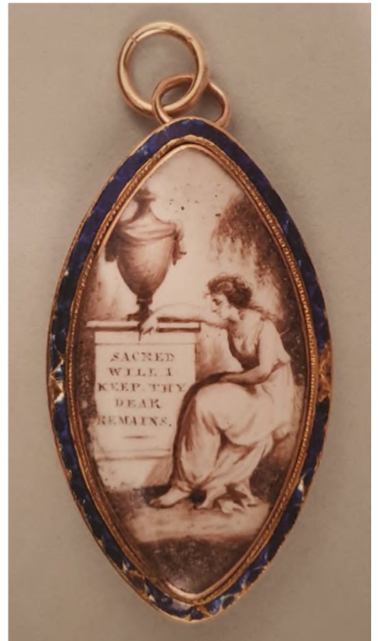
Afb. 5: Neoclassicistisch rouwjuweel, sepia op ivoor, eind 18 de eeuw.

Vanaf 1760 brachten enkele neoclassicistische elementen orde in de asymmetrie, en populair werden ook de rouwjuwelen waarin ivoren sepia miniatuurtjes werden verwerkt. Daarop huilen klassiek geklede maagden onder wilgen over urnes, serene grafzerken of gebroken zuilen (afb. 5). In de sepia inkt werden bovendien dikwijls snippers haar verwerkt en aan de achterkant werd de naam en sterfdatum van de overleden persoon gegraveerd. 24 Daarbij kwam in 1780 vanuit Frankrijk de mode van het oogminiatuurjuweel op (afb. 6), 25 een mysterieus en toch wel sensueel juweel