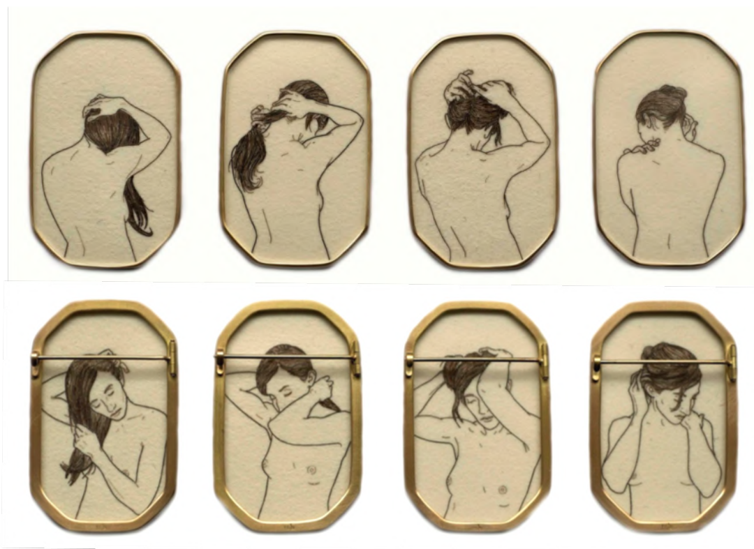
Afb. 14: Melanie Bilenker, Pinning , serie broches, 2013.