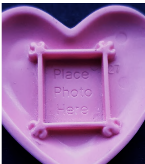
Afb. 26: "Place Photo Here".