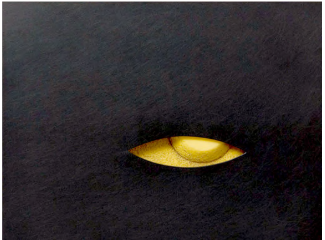
Afb. 16: Otto Künzli, Auge X (onderdeel van de serie Augenblick ), broche, 2017.

De Duitse juweelkunstenaar Otto Künzli liet zich daarentegen, net als de 18 de -eeuwse juweelmakers, verleiden door het oog. Augenblick laat een serie aan 'ogen' zien die een spel spelen met de blik (afb. 15-16-17), met zien en gezien worden. Plots begluren voyeurs zichzelf, want het sieraad wordt een instrument voor zelfbeschouwing, een medium voor confrontatie. 37