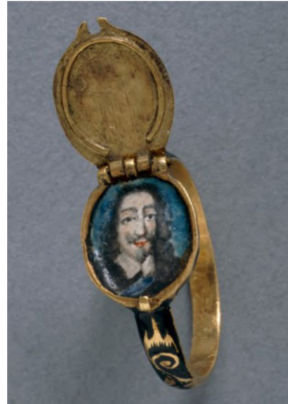
Afb. 2: Rouwring met portret van koning Charles I, 1650.

Deze gewoonte werd in het begin van de 18 de eeuw openlijker voortgezet, want de liefde voor het sentimentele nam toe. Ook al zegevierde de rede in de tijd van de Verlichting, in de filosofie en nadien ook in de literatuur zette het sentimentalisme zich door, een stroming die pleitte voor de waarde van de emotie en benadrukte dat er meer was dan enkel ratio. 21 Zo werden bovenvermelde symbolen die verwezen naar de dood nog steeds gebruikt, zoals te zien is aan een zwart geëmailleerde rouwring die de herinnering aan een zekere Edward Wigglesworth in leven houdt (afb. 3). 22 Wel nam een meer