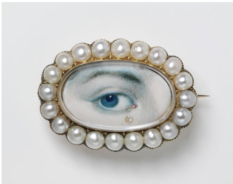
Afb. 6: Lover's Eye broche uit Engeland, 18 de eeuw. De diamanten traan gaf vermoedelijk aan dat de afgebeelde persoon overleden was.

– veelal broches of hangers – met een miniatuurportret van het oog van een geliefde. De identiteit van de geportretteerde was veelal enkel geweten door de persoon die het juweel koesterde; het was een juweel dat indringend op hem of haar inwerkte, aangezien deze zich tijdens het kijken naar het oog meteen ook zelf bekeken voelde. 26 De Engelse koningin Victoria, die verknocht was aan sentimentele juwelen en in het bijzonder aan deze oogminiaturen, hield deze mode nog tot bijna halverwege de 19 de eeuw in leven. 27