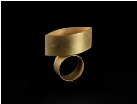
Afb. 15: Otto Künzli, Catoptric Ring , ring, 1992. 'Catoptric' is Oudgrieks voor spiegel of reflector. Zo bevat de ring een spiegel die het oog van de kijker terugkaatst.

De Duitse juweelkunstenaar Otto Künzli liet zich daarentegen, net als de 18 de -eeuwse juweelmakers, verleiden door het oog. Augenblick laat een serie aan 'ogen' zien die een spel spelen met de blik (afb. 15-16-17), met zien en gezien worden. Plots begluren voyeurs zichzelf, want het sieraad wordt een instrument voor zelfbeschouwing, een medium voor confrontatie. 37