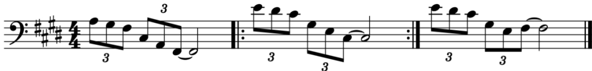
Afbeelding 15: Sample A "Gele Blokken" 226

Deze instabiele structuur wordt weergegeven in afbeelding 14; er is geen sprake van een refrein of een terugkerend segment, waardoor de luisteraar helemaal niet weet wat hij kan verwachten. Elke maat klinkt als een verrassing omdat telkens een bepaald element veranderd is ten opzichte van de vorige maat. Het nummer bestaat uit twee strofes die verschillend zijn vanwege het gebruik van andere samples. Deze strofes worden van elkaar gescheiden door een zeer kort tussenspel dat andere klanken bevat: het geluid van politiewagens, honden die blaffen en iemand die roept. Aan het einde wordt een outro gespeeld die nogmaals totaal anders klinkt. Het lijkt op een fragment uit een reportage waarin men spreekt over een ‘dorpse sfeer’. Het staat in schril contrast met de rest van het nummer, omdat dit het einde luchtig maakt, terwijl we doorheen het volledige nummer enkel een zware en donkere sound krijgen. 227