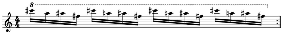
Afbeelding 4: Sample C in “An Open Letter to NYC” 182

Na twee maten van samples B en C, worden twee nieuwe samples voorgesteld in de baspartij, respectievelijk ‘sample D’ en ‘sample E’ genoemd (zie afbeeldingen 5 en 6). Dat de Beastie Boys origineel een punkband was, toont zich in sample E. Ze gebruikten namelijk een fragment uit “Sonic Reducer” van de Amerikaanse punkband Dead Boys. Vanaf het moment dat sample E wordt geïntroduceerd in het nummer, wordt deze onveranderlijk herhaald tot het einde. Dit is dus de ‘basic beat’. Het lijkt erop dat alle andere samples, een afgeleide zijn van sample E. De noten die worden voorgesteld in de ‘basic beat’ worden omspeeld in de andere lagen. 183