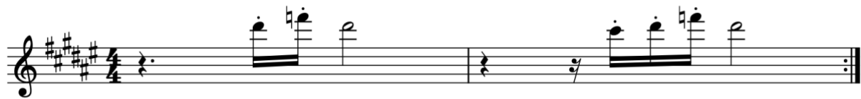
Afbeelding 19: Vereenvoudiging sample B "I Love You" 239

De rijmvormen en -schema's zijn veel minder helder dan het samplegebruik. Er wordt in overvloed gebruik gemaakt van 'multi-liners' met binnenrijm, tot soms gedurende veertien maten. Soms is het moeilijk om een grens te trekken tussen de ene 'multi-liner' en de volgende, omdat de rijmwoorden erg op elkaar lijken. De bedoelingen van de artiest zijn daarbij niet altijd duidelijk, het is namelijk niet eenduidig of woorden bedoeld zijn om met elkaar te rijmen of niet. 240 Zo komt in strofe 1 volgende passage voor: