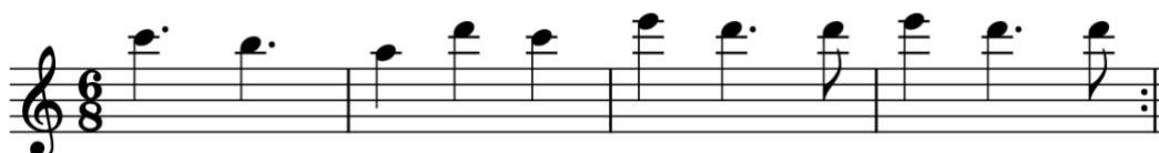
Afbeelding 13: Sample, ‘basic beat’ in "La Belgique Afrique" 210

In de intro wordt meteen de ‘basic beat’ voorgesteld: een pianosample van vier maten (afbeelding 13). Het wordt doorheen het volledige nummer onveranderlijk herhaald. Deze sample wordt aangeduid als een non-percussie structuursample omdat enkel een melodisch instrument wordt gebruikt. Uit de opeenvolging van de tonen kan worden afgeleid dat de toonaard van deze sample a-klein is. De eerste noot van elke maat is een akkoordnoot van a: in maat 1 zien we c, in maat 2 a, en in maat 3 en 4 e. De toonaard wordt echter in het stuk nooit bevestigd omdat de sample altijd eindigt op een d, wat de subdominant is. Dit zorgt voor een onzeker gevoel, alsof er iets ontbreekt in het nummer. 209