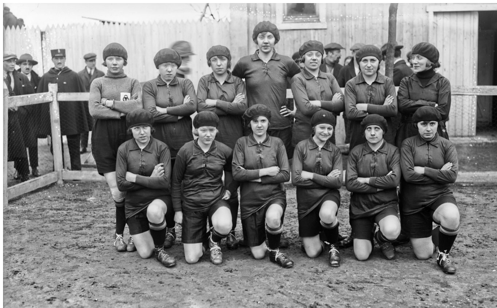
Afbeelding 13: De Belgische vrouwenploeg in Frankrijk, 1924. Bibliothèque Nationale De France, geraadpleegd 5.8.2021, https://gallica.bnf.fr/ark:/12148/btv1b531261908.r=%22football%20feminin%22%2C%20belgique?rk=21459;2 .