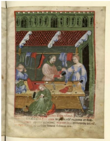
Afbeelding 2: Parijs: Bibliothèque Nationale de France. Département des Manuscrits , ms. NAL 1673, f° 95r: Tacuinum Sanitatis , ca. 1390-1400.

Online geraadpleegd via: Gallica , Bibliothèque Nationale de France .