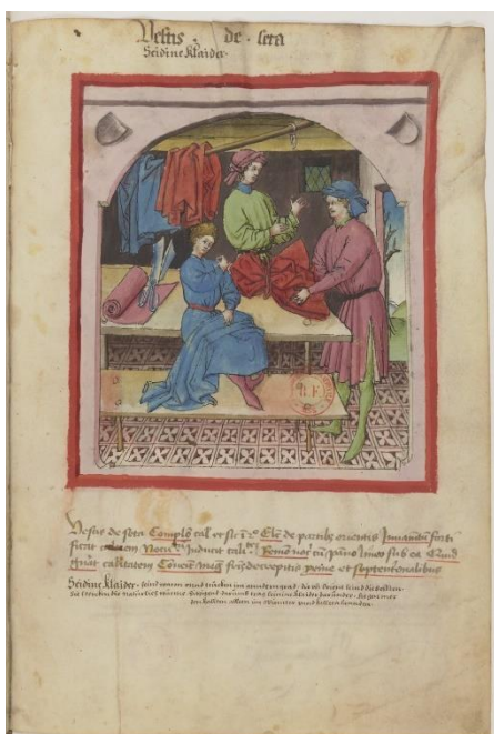
Afbeelding 3: Parijs: Bibliothèque Nationale de France. Département des Manuscrits , ms. Latin 9333, f° 104r: Tacuinum Sanitatis , ca. 1500.