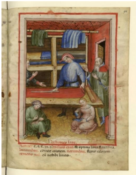
Afbeelding 1: Parijs: Bibliothèque Nationale de France. Département des Manuscrits , ms. NAL 1673, f° 94r: Tacuinum Sanitatis , ca. 1390-1400.

Online geraadpleegd via: Gallica , Bibliothèque Nationale de France .