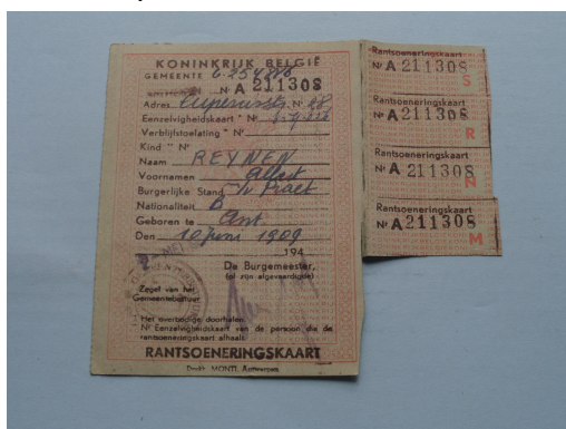
Afb1.: Rantsoeneringskaart Antwerpen.

Met de bonnetjes aan de rantsoeneringskaart kon een beperkt aantal of gewicht aan voedsel gekocht worden. De rantsoeneringskaart heeft echter de voedselschaarste niet geheel kunnen oplossen. 60