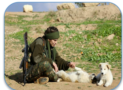
Vrouwelijkheid in het kamp: dailymail.co.uk, 6/7/15; nbc.com, 10/9/14, dailymail.co.uk, 13/12/15