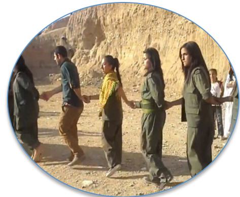
Community- gevoel, van links naar rechts: