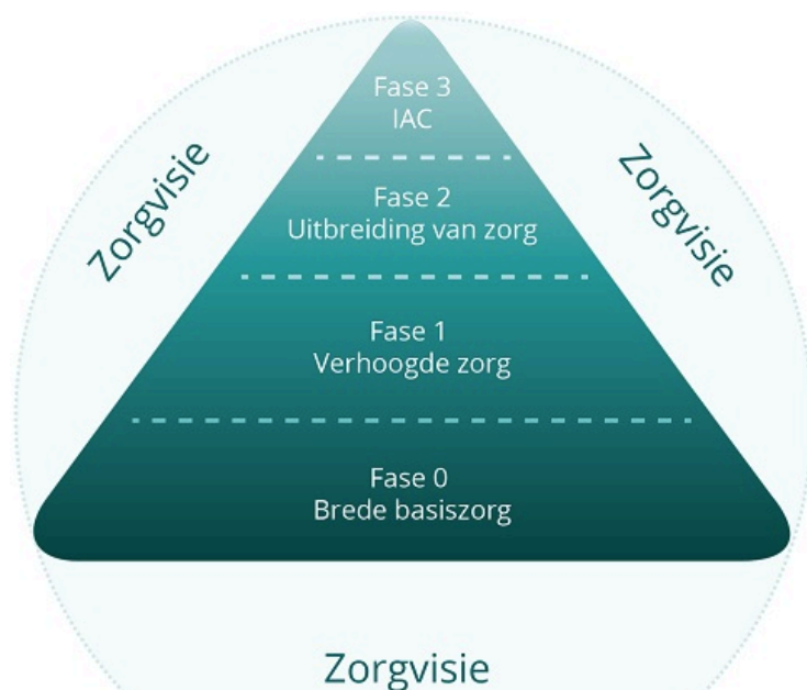
Figuur 3: Zorgcontinuüm. Overgenomen uit Prodiagnostiek . Door Prodia.

Om de zorg voor leerlingen te optimaliseren, maakt men in de leerlingenbegeleiding gebruik van het zorgcontinuüm. Het uitgangspunt hiervan is dat elke school een visie op zorg moet uitbouwen en van hieruit haar beleid vorm moet geven. Het zorgcontinuüm bestaat uit vier zorgfases. De school is verantwoordelijk voor fase 0 en fase 1. Uiteraard kunnen ze hierbij ondersteund worden door het CLB en de Pedagogische Begeleidingsdienst. Vanaf fase 2 is het CLB verantwoordelijk, maar deze blijft nauw samenwerken met de school, de ouders en de leerling zelf (Prodia, 2016).