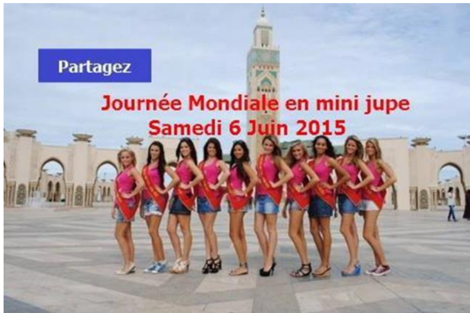
Figuur 10 Profielfoto van het Facebookevenement Internationale Dag van de Minirok

In de Vlaamse media werd dit evenement en de daarbij horende betoging in Tunis op 6 juni uitgebreid aangekondigd in de dagen voor mijn vertrek. In de kranten stonden titels als ‘Draag een minirok op 6 juni’ (KM, 2015), ‘Vrouwen protesteren met minirokdag tegen Facebookgroep van ‘echte mannen’ en op ook op Studio Brussel en Radio 1 riep men op tot het dragen van een minirok als protest. Op BBC sprak men zelfs over ‘ The battle between the veil and the miniskirt ’ (Doyle, 2015). Het was een reactie op een Facebookgroep van Algerijnse islamisten genaamd “ Be a man, don’t let your women out in revealing clothes ”. De pagina werd ondertussen van het internet gehaald, de kern van hun betoog bestond uit foto’s van mannen die pronkten met hun gesluisde vrouw. Uit solidariteit met de Algerijnse vrouwen bedacht men in Tunesië deze betoging tegen de Algerijnse campagne. Ik was in Tunis op 6 juni en ik heb bijzonder weinig vrouwen in minirok gezien. Hoe hard deze campagne ook werd gepromoot in het buitenland, in Tunis zelf had ze maar weinig respons. Vrouwen bepalen er immers zelf wat ze dragen. Wat zij netjes en mooi vinden, met of zonder hoofddoek, met of zonder make-up, het maakt allemaal niet zo veel uit, als ze maar goed voor de dag komen.