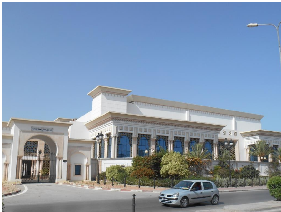
Figuur 7 Voormalige Chambre des Adviseurs

Nog dichterbij huis zat La Chambre des Adviseurs . Tot januari 2014 maakte deze deel uit van het parlementair tweekamersysteem van Tunesië, samen met La Chambre des Députés die verderop in het Palais du Bardo naast het Bardo Museum is gevestigd. Sinds de grondwetsherziening in 2014 is dit systeem vervangen door één Assemblée des Représentants du Peuple . Aan het hoofd hiervan staat Mohamed Ennaceur, leider van de meerderheidspartij Nidaa Tounes.