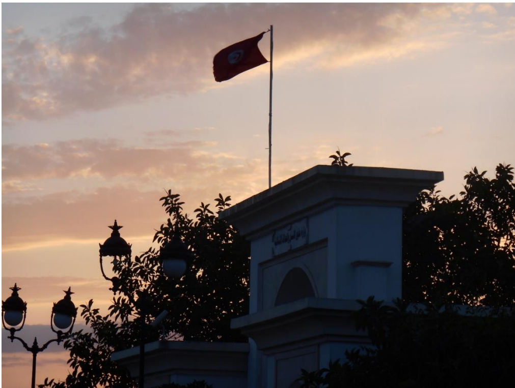
Figuur 9 Voormalige Chambre des Adviseurs bij zonsondergang

Zo werd ik tegengehouden door de security van het gebouw van L'Assemblée des Représentants du Peuple . Ik had die avond enkel foto's genomen van de Tunesische vlag bovenop de ingangspoort. Ik kon meteen een vijftal foto's van de vlag laten zien en benadrukte dat het mij te doen was om het mooie avondlicht. Gelukkig werd mijn fototoestel niet doorzocht zoals bij Jena. Tijdens de eerste dagen van mijn verblijf heb ik veel foto's genomen van alles wat ik zag, ook van overheidsgebouwen wegens de constructies in prikkeldraad. Dit is blijkbaar verboden. Tot zo ver de veelbesproken Tunesische vrijheid.