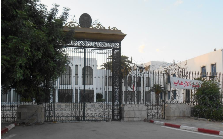
Figuur 6 Palais du Bardo

Nog dichterbij huis zat La Chambre des Adviseurs . Tot januari 2014 maakte deze deel uit van het parlementair tweekamersysteem van Tunesië, samen met La Chambre des Députés die verderop in het Palais du Bardo naast het Bardo Museum is gevestigd. Sinds de grondwetsherziening in 2014 is dit systeem vervangen door één Assemblée des Représentants du Peuple . Aan het hoofd hiervan staat Mohamed Ennaceur, leider van de meerderheidspartij Nidaa Tounes.