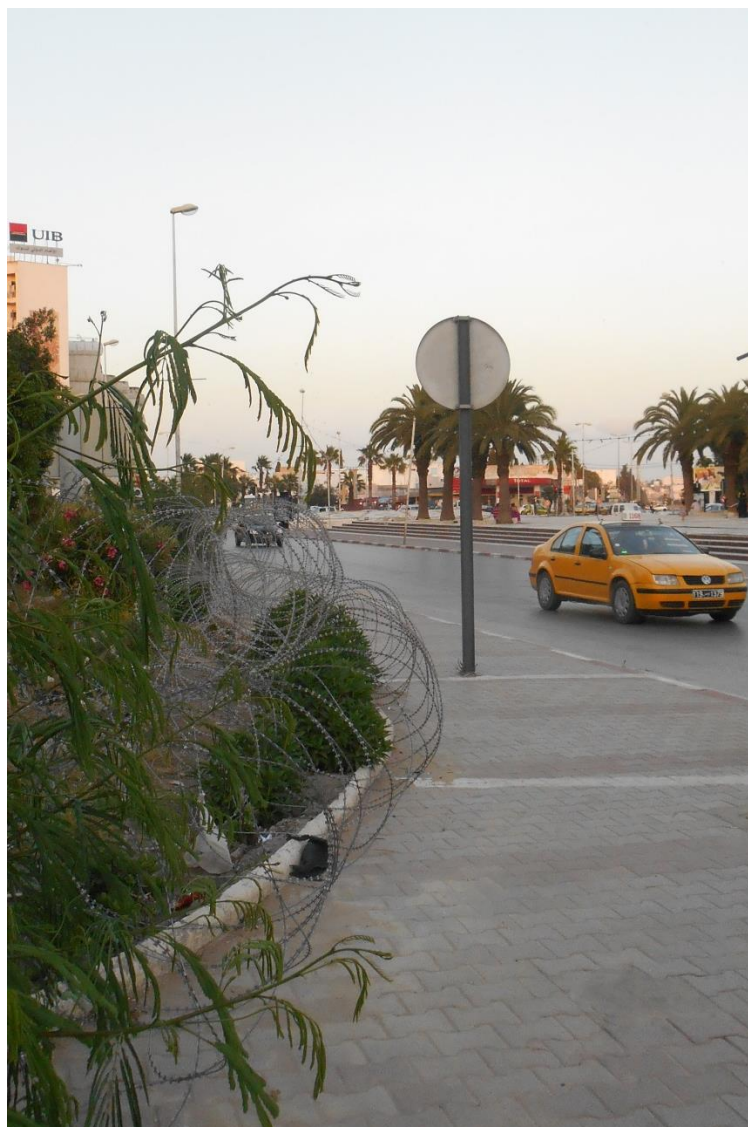
Figuur 8 Prikkelraad rondom het Palais du Bardo

Wat zich nu achter de muren van dit prachtige gebouw afspeelt, weet ik niet maar het wordt nog steeds streng bewaakt. Behalve de aanslag op het Bardo Museum verklaart ook de ligging van al deze overheidsgebouwen de massale aanwezigheid van de politie. ‘Aanwezigheid’ dient letterlijk te worden genomen want om de 50 m blokkeren ze met hun dienstvoertuigen het hele voetpad maar verder doen ze absoluut niets, tenzij intimiderend naar vrouwen kijken en hen nafluiten. De gebouwen zijn imposant en ze zijn omgeven door piekfijn onderhouden tuinen maar de politieaanwezigheid en het prikkeldraad doen de schoonheid verbleken. Het prikkeldraad ziet er afschuwelijk uit, er blijft heel veel afval tussen hangen. Als het druk is op straat ben ik bang om te struikelen en me te bezeren.