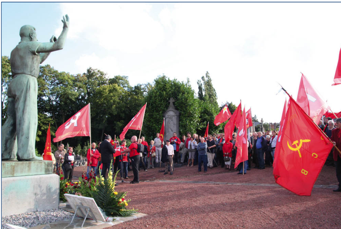
16. Herdenking van de zestigste verjaardag van de moord op Julien Lahaut, bij zijn grafmonument, 2010.