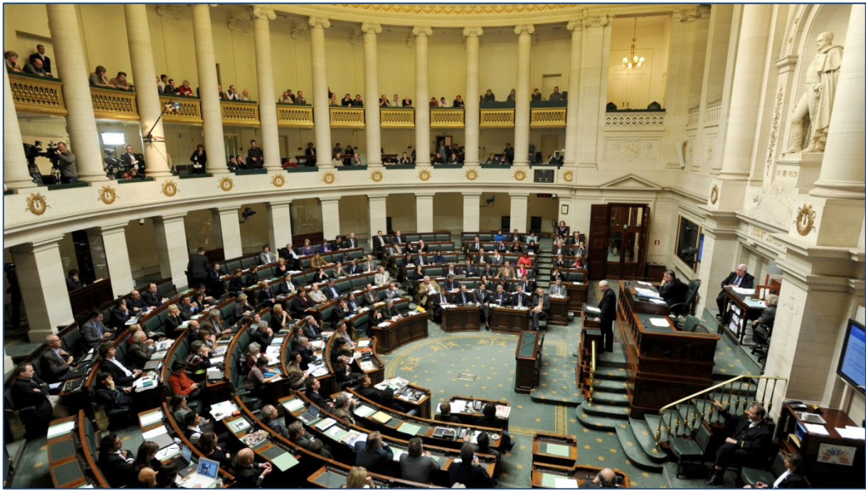
11. De Belgische Kamer van Volksvertegenwoordigers, s.d.