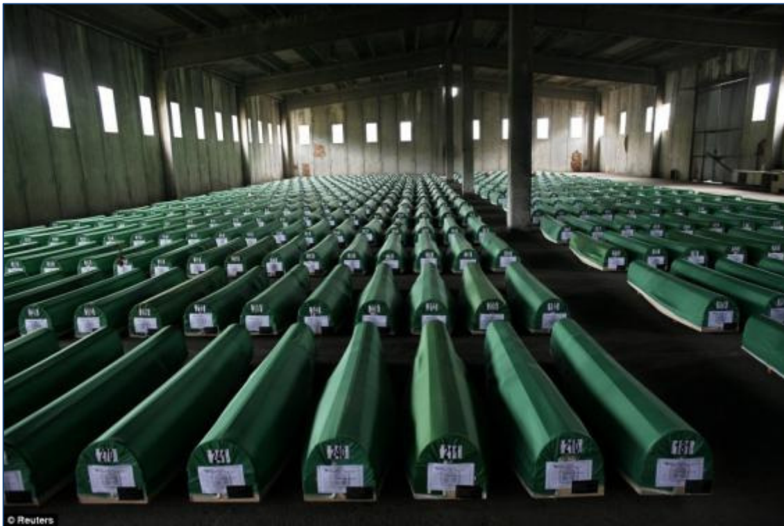
12. Herbegravenis van 600 slachtoffers van de val van Srebrenica, na identificatie, 2005.