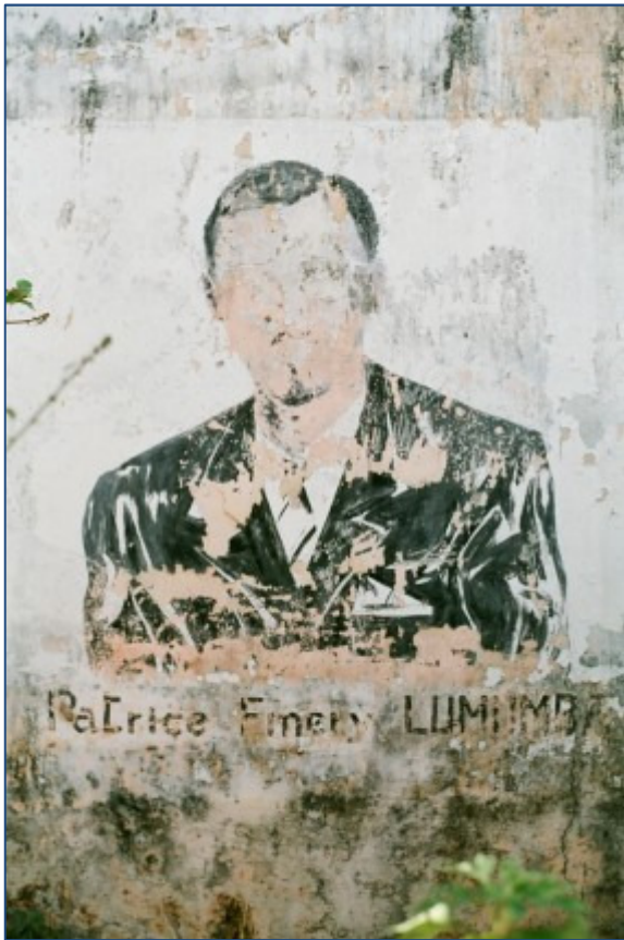
13. Muurschildering op de ruïnes van Maison Brouwez , 1988.