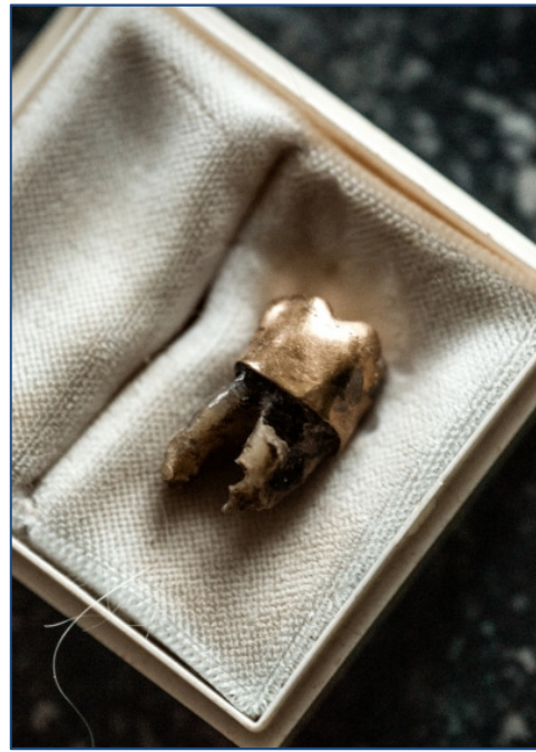
8. Vergulde kies van Patrice Lumumba, 2016.