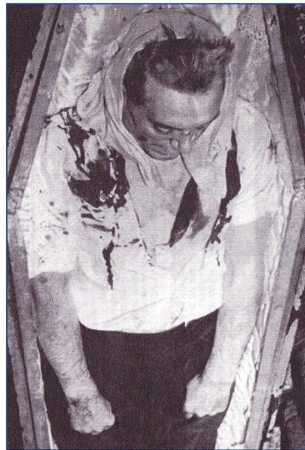
10. Lijkfoto van Julien Lahaut, 1950.