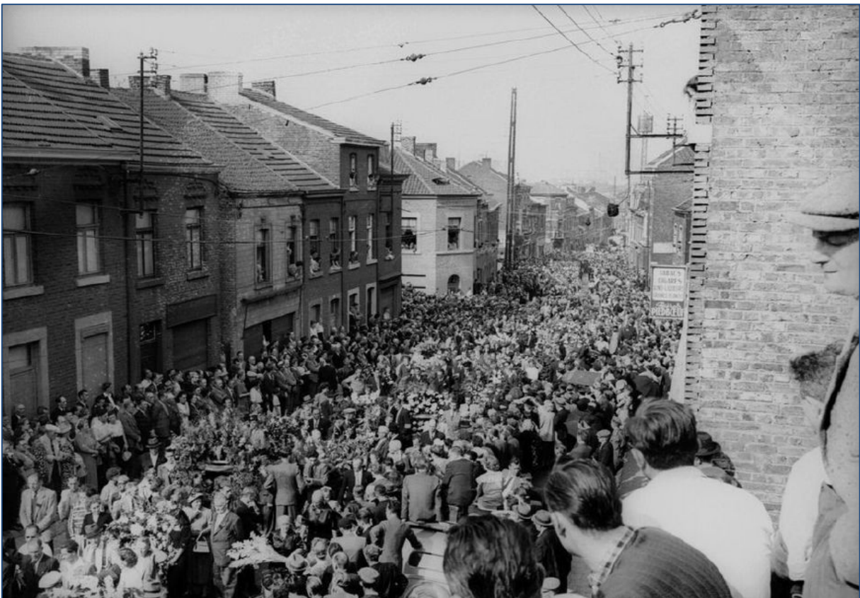
6. Begrafenis van Julien Lahaut te Seraing, 1950.