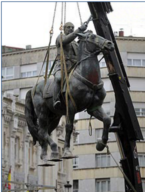
18. Verwijdering van een ruitersstandbeeld van Francisco Franco in Madrid, 2008.