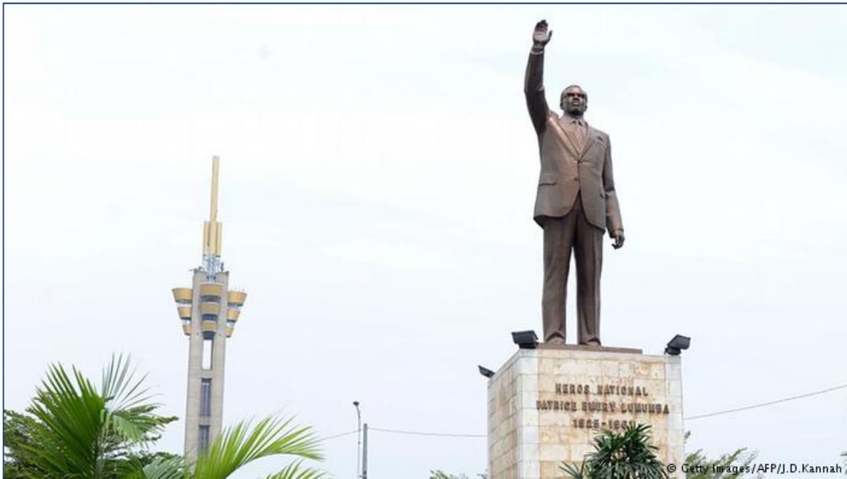
17. Monument voor Patrice Lumumba in Kinshasa, s.d.