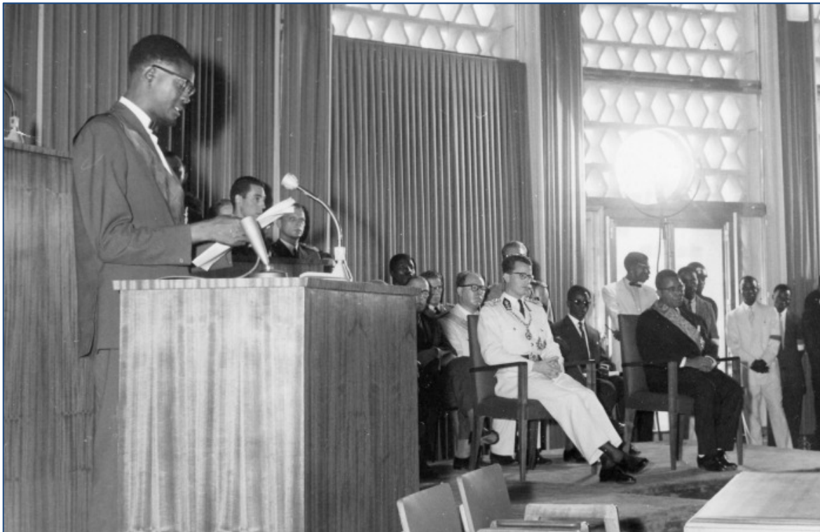
15. Patrice Lumumba (links), koning Boudewijn (midden) en Joseph Kasavubu (rechts) bij de onafhankelijkheidsfeesten van Congo, 1960.