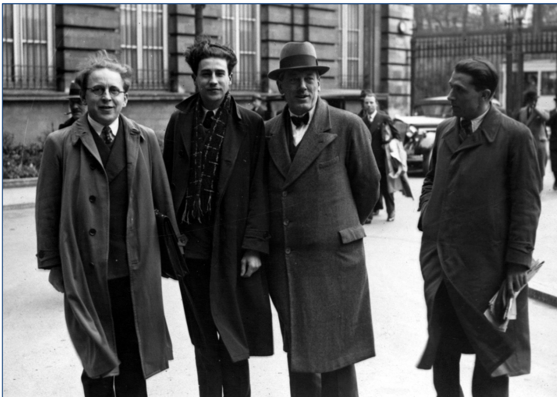
14. Julien Lahaut (3 de van links) bij het Belgische parlement, samen met leden van zijn partij, 1936.