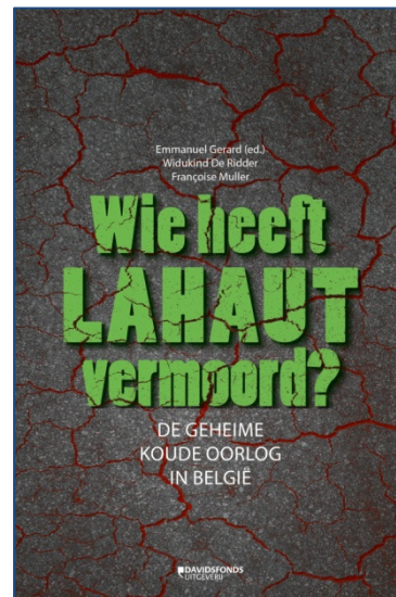
2. Kaft van het verslag van de commissie-Lahaut, 2015.