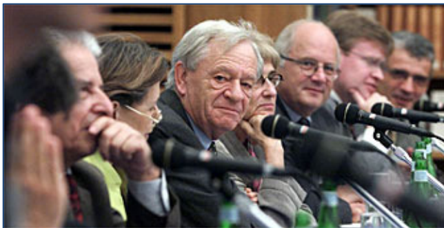
3. De voltallige commissie-Bergier, met centraal Jean-François Bergier, 2001.