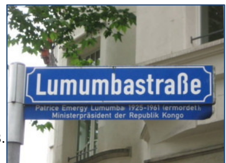
19. De Lumumbastraße in Berlijn, 2013.