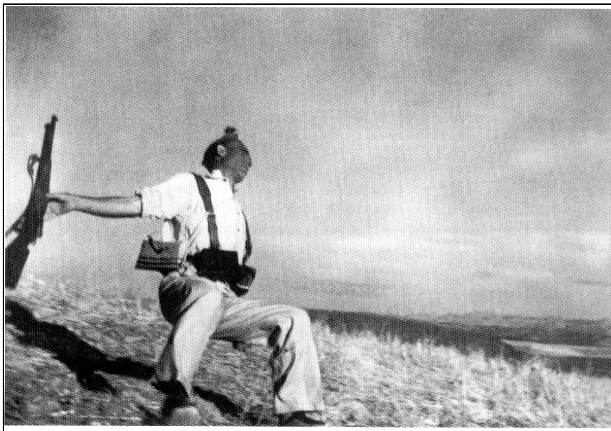
The Fallen Soldier, 1936: 'Death in Spain: The Civil War has taken 500,000 lives in one year' .