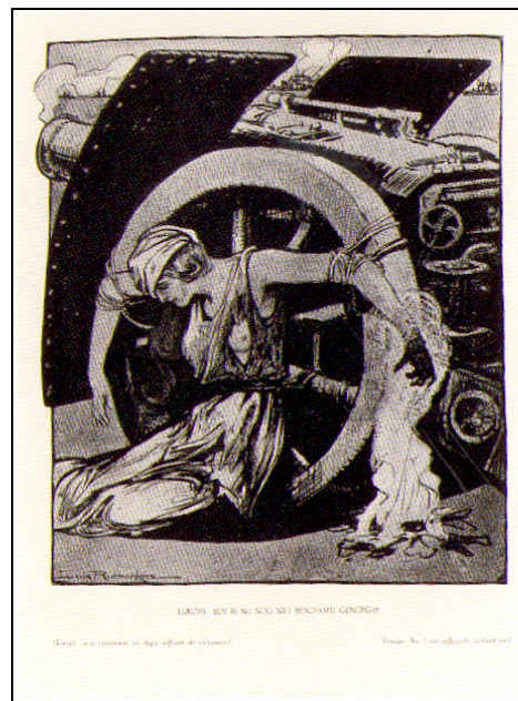
Louis Raemaekers, Europa: ben ik nu nog niet beschaafd genoeg?, Nederland, 1915

Voor de eerste wereldoorlog kunnen we besluiten dat vooral de technologie en het militaire apparaat de grootste druk op de verslaggeving legden. Het oorlogsbericht was ook in de moderne oorlogsvoering opnieuw als propagandamiddel ontdekt en zou nooit meer verdwijnen.