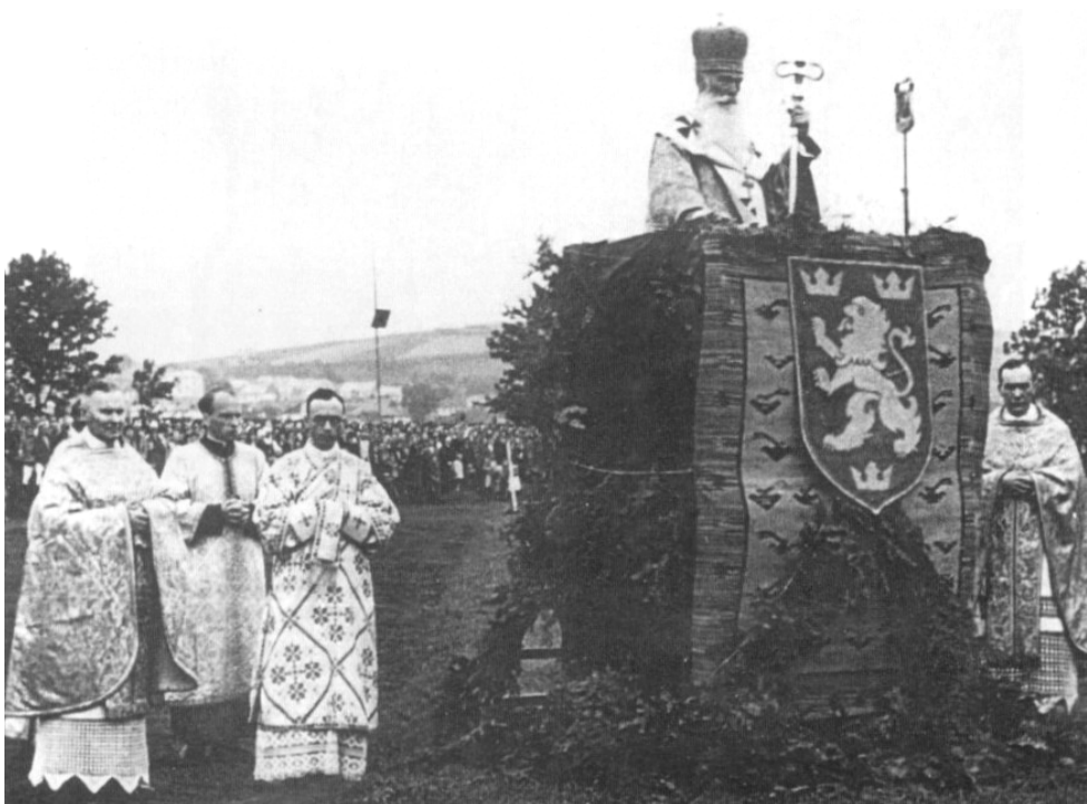
Figuur 16: Ook de Grieks-katholieke Kerk steunde de collaboratie. Bisschop Josafat Kocylovs'kyj spreekt Oekraïense vrijwilligers toe in juli 1943. Let op het embleem: een Galicische leeuw; de Oekraïense drietand was immers verboden.

pacificaties van Poolse dorpen, aangezien een deel van de officieren op contractuele basis in het vooroorlogse Poolse leger gediend had. 332