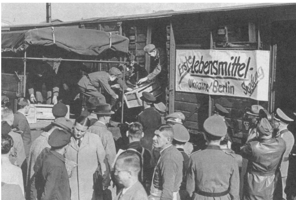
Figuur 11: Op 30 juni kwam de eerste trein met 'levensmiddelen uit Oekraïne' toe in Berlijn.

In april 1942 werd op de Tweede Conferentie van de OUN-r een strategie uitgewerkt. Het doel was een soevereine en onafhankelijke Oekraïense staat. De leiding voorspelde verschillende scenario's over het einde van de oorlog. De nationaal-revolutionaire en militaire krachten moesten voorbereid zijn: de gehele natie diende zich te verenigen in één beweging, de militaire organisatie diende uitgebouwd te worden en op het gepaste moment zou de revolutie dan losbreken. Oost-Galicië werd daarbij ingericht als de trainings- en bevoorradingsbasis voor de verzetsbeweging in Volhynië. In afwachting van de ultieme slag om een onafhankelijk Oekraïne mocht de bevolking haar energie niet verliezen in partizanenacties. De OUN-r verzette zich tegen elke bezetter en veroveraar met als grootste vijand het 'Moskovitische imperialisme' en in de tweede plaats het 'huichelachtige Duitsland'. 154 Ze ondernam echter nog niets tegen leden die onder Duitse standaard dienden. Polen, die in het Duitse bestuur tewerkgesteld waren, werden wel (op kleine schaal) aangevallen. 155