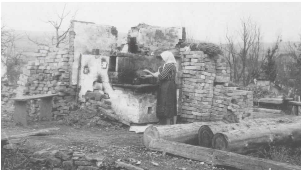
Figuur 23: Een vernield dorpje in de streek Bieszczady (1946)

van 1948 uitgeschakeld werden. 445 De OUN bleef als conspiratief netwerk in gereduceerde vorm bestaan tot het begin van de jaren 1950, maar vormde geen reëel gevaar voor de Poolse staat.