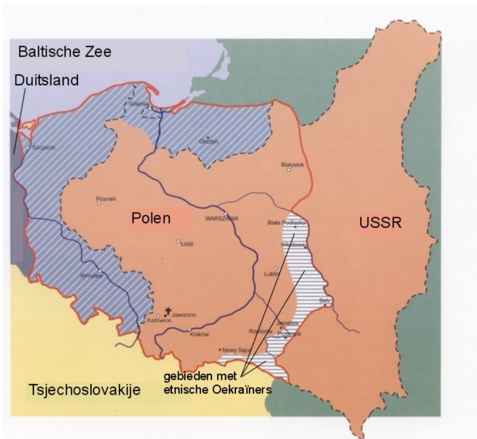
Figuur 20: De gebieden in Polen, waar ongeveer 650.000 tot 700.000 etnische Oekraïners woonden

Dus werd de druk op de Oekraïense bevolking op verschillende manieren opgevoerd. NKVD-eenheden en Poolse veiligheidstroepen traden gewelddadig op tegen de Oekraïense bevolking. In het district Przemyśl gaf de commandant van de Poolse burgermilitie (MO) het bevel Oekraïners te arresteren die weigerden te verhuizen. 403 Vanwege de negatieve ervaringen met de UPA oefende ook de Poolse bevolking druk uit. Bovendien voerde in sommige gebieden de AK een terreurbeleid tegen de Oekraïense bevolking. Op het hoogste niveau werd eveneens ingegrepen. De Poolse communistische autoriteiten planden bij landbouwhervormingen Oekraïners te negeren. Maar ze troffen de Oekraïense