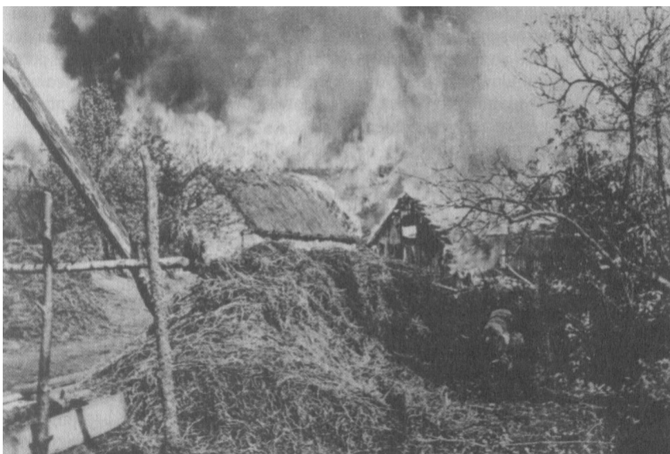
figuur 25: Een brandend Oekraïens dorp

nationalisme. 546 De vraag of de UPA anti-Pools was, stelt zich niet bij de meeste historici. Serhijčuk stelt dat de UPA "actief was op etnische territoria van de Oekraïense natie, streed voor een onafhankelijk Oekraïne op haar eigen etnische gebieden en niet in vreemde territoria". 547 Op verwijten van integraal nationalisme reageren ze met cijfermateriaal over het multi-etnische karakter van de UPA. Zo telde ze in het najaar van 1943 1.000 tot 2.000 Kazachen, Georgiërs, Litouwers, Azerbeidzjanen... 548