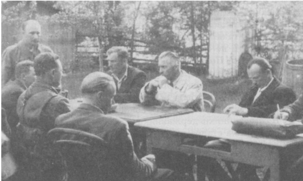
Figuur 21: Onderhandelingen tussen de UPA en de WiN in het dorp Ruda Różaniecka (70 km ten zuiden van Zamość) op 21 mei 1945