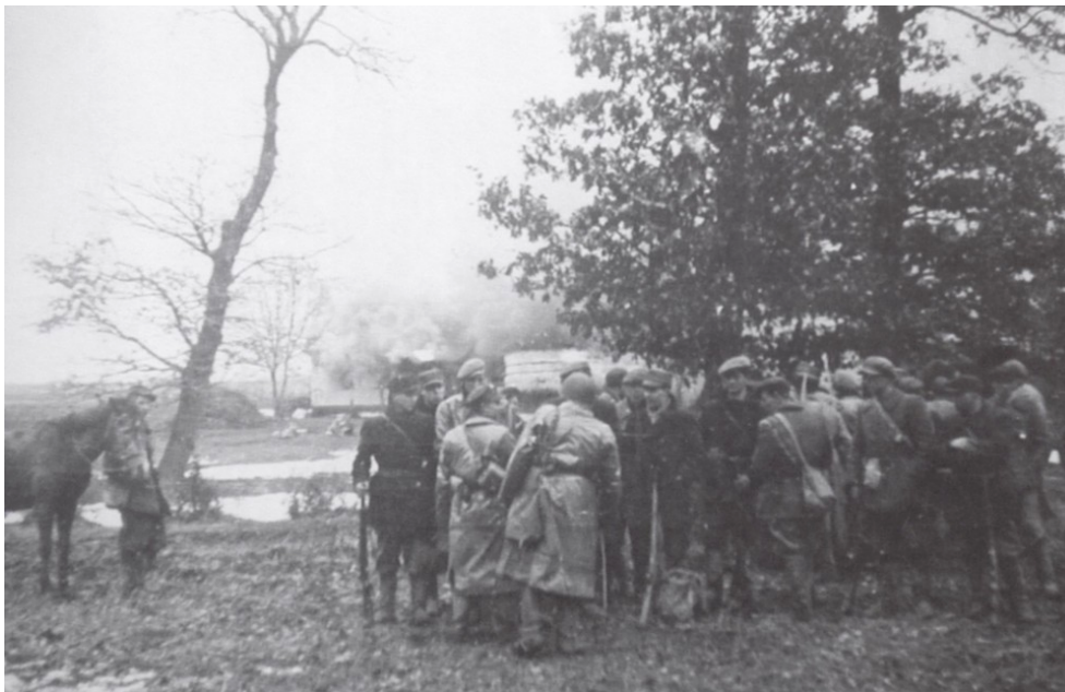
Figuur 17: AK-partizanen met op de achtergrond een brandend dorp (maart 1944)

In januari startte de UPA haar campagne om Oost-Galicië te depoloniseren. Tegen het einde van januari 1944 waren enkele honderden Polen omgekomen. Polen beschuldigden UPA-eenheden die vanuit Volhynië opereerden. 350 In februari spoelde een eerste golf van etnische zuiveringen over de provincie Ternopil en het noord-oosten van de provincie Lviv. In maart en april breidde de golf zich westwaarts uit. Het geschreven bevel van een lokale leider van de UPA luidde op 4 april: "Niemand niet sparen, zelfs in het geval van gemengde huwelijken Polen uit de huizen halen, maar Oekraïners en kinderen in die huizen niet liquideren." 351 Maar ook eenheden van de AK en van de Boerenbataljons voerden massamoorden uit onder de Oekraïense bevolking.