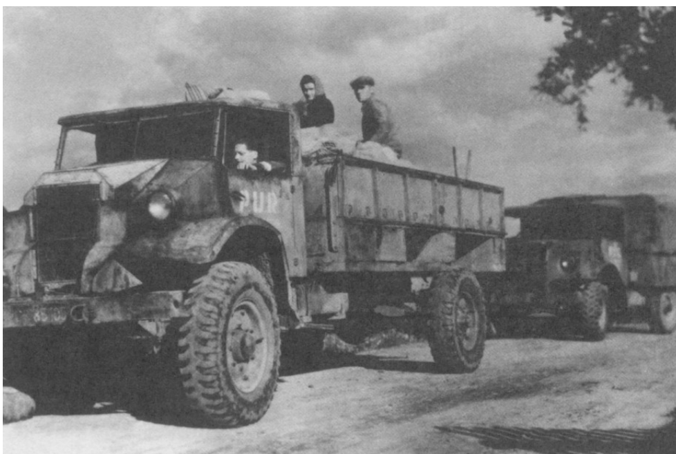
Figuur 24: ‘Repatriëring’ naar Polen per vrachtwagen

Dus besloten de sovjetautoriteiten de druk op etnische Polen op te voeren. In de eerste helft van januari 1945 werden in Lviv 2.100 ‘vijandige (Poolse) elementen’ gearresteerd. 453 In totaal werden er in de winter van 1944-1945 2.200 tot 3000 Polen gearresteerd in Oost-Galicië. In het begin van 1945 werden 3.500 Polen van West-Oekraïne, waarvan 2.200 uit Lviv en 900 uit Drohobysj, naar kampen in de Sovjet-Unie afgevoerd, hoewel deportaties vooral de Oekraïense bevolking viseerden. 454 Ook werden Polen gemobiliseerd in de divisie van Berlinger, in het sovjetleger of in werkbataljonnen die elders in de Sovjet-Unie ontplooid werden. 455 De sovjetleiding wilden hiermee niet enkel druk uitoefenen op de Poolse bevolking, maar ook de Poolse verzetsbeweging breken. De arrestaties troffen de AK op een efficiënte wijze zodat deze geen reële bedreiging meer vormde. 456 Ook de katholieke Kerk, die Polen oproep in Oost-Galicië en Volhynië te blijven, werd vervolgd.