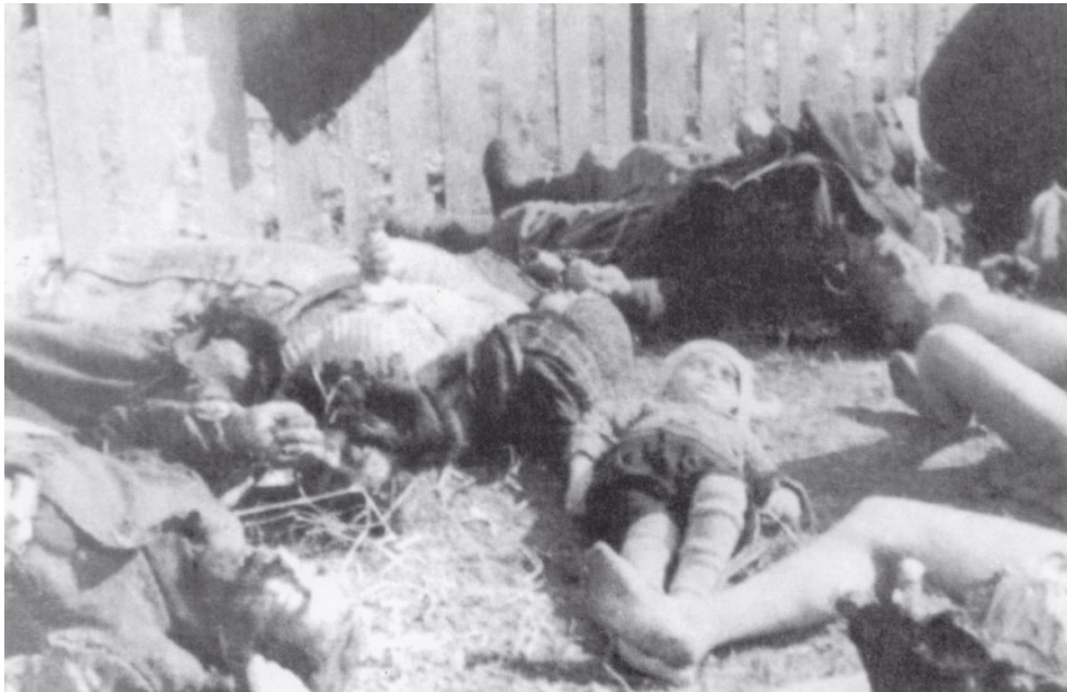
Figuur 14: De Poolse kolonie Lipki, uitgemoord op 26 maart 1943

In april breidde het geweld zich territoriaal verder uit. Het etnische conflict speelde zich thans af in de driehoek Kovel-Kremenets-Sarny. Dorpen en nederzettingen werden aangevallen en honderden Poolse burgers vermoord. Een motief dat vaak gebruikt werd voor de moordpartijen, was echte of vermeende samenwerking met Duitsers of sovjetpartizanen. Niet zelden vielen er ook Oekraïense burgers die in nauw contact stonden met Polen of de autoriteit van de Oekraïense nationalisten in vraag stelden. Op 23 april werd de nederzetting Janowa Dolina in het district Kostopil aangevallen door de UPA. 249 Hierbij kwamen 500 Polen om en werd twee derde van de gebouwen platgebrand. 250 Ook in mei en juni vielen honderden slachtoffers.