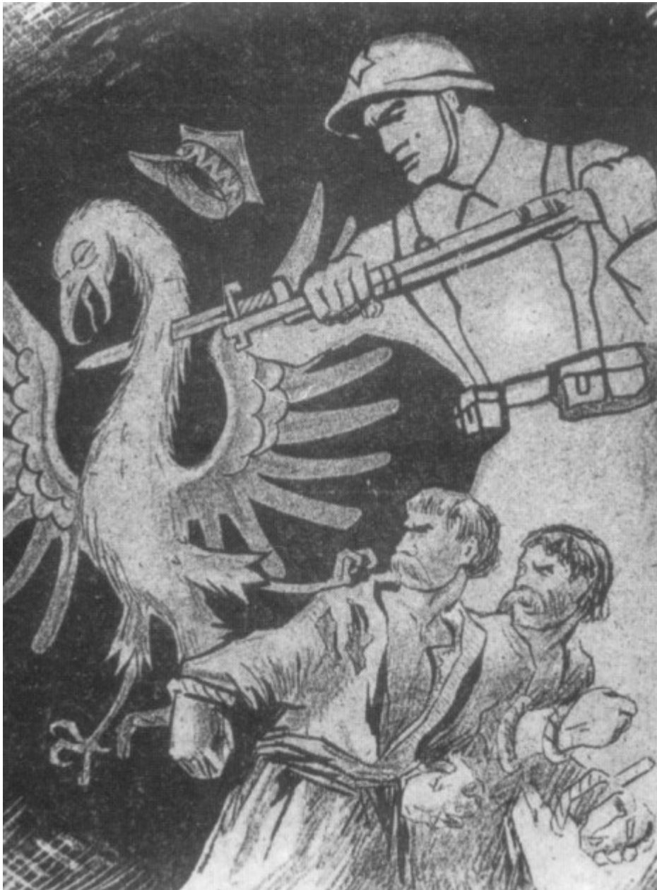
Figuur 7: Sovjetpropaganda: een sovjetsoldaat doorsteekt de witte adelaar (het symbool van Polen) en bevrijdt twee Oekraïners

Een tweede oorzaak was de dominant Poolse participatie aan het vooroorlogse staatsapparaat. In de initiële fase van de machtsgreep en -installatie diende de oude structuur grondig vernietigd en haar elite geëlimineerd te worden, opdat het maatschappelijke weerstandsvermogen