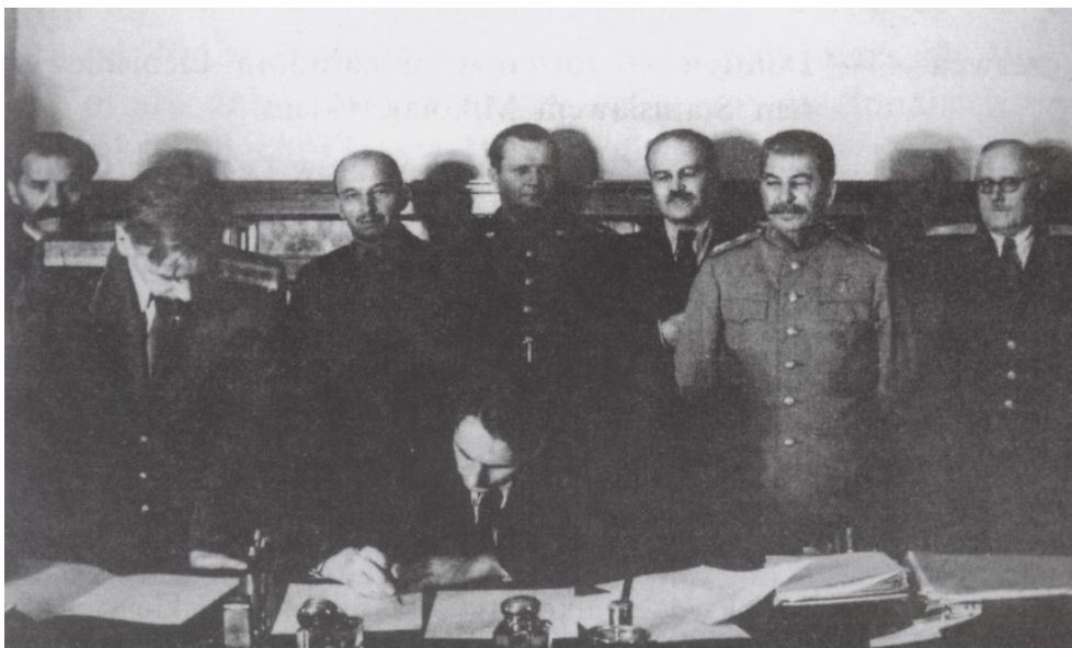
Figuur 19: Edward Osóbka-Morawski ondertekent het akkoord over de oprichting van de PKWN.

Sovjet-Unie over de grens. 382 Deze werd voornamelijk op de Curzonlinie gebaseerd, waarbij Polen de oostelijke etnisch gemengde gebieden verloor in ruil voor westelijke (Duitse) territoria. 383 De AK en de Poolse regering in ballingschap te Londen stonden machteloos want hun geallieerde bondgenoten hadden met de nieuwe grenslijn ingestemd. Reeds op de Conferentie van Teheran (november-december 1943) hadden de westelijke geallieerden (Churchill en Roosevelt) hun fiat gegeven voor de nieuwe grens. 384 Deze werd nogmaals formeel bevestigd op 16 augustus 1945 door Edward Osóbka-Morawski, de Poolse premier van de Voorlopige Regering (van Nationale Eenheid) en Vjačeslav Molotov, de sovjetminister (volkscommissaris) van Buitenlandse Zaken.