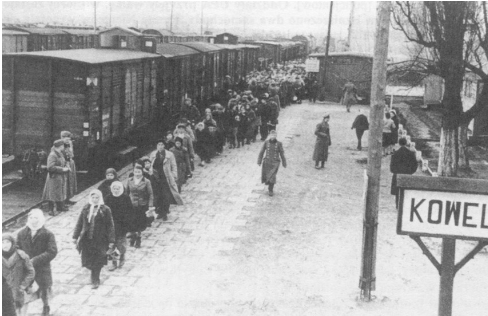
Figuur 10: Het station in Kovel (in Volhynië). Vrouwen worden gedeporteerd naar Duitsland

De grote verwachtingen die Oekraïense nationalistیں koesterden, werden getemperd, maar niet geëlimineerd. Op 30 juni 1941 was in Lviv de wedergeboorte van een onafhankelijke Oekraïense staat uitgeroepen door aanhangers van Bandera. Een regering werd gevormd onder leiding van Jaroslav Stec'ko. Ook elders hadden manifestaties en proclamaties plaatsgevonden. Dankbetuigingen aan het Duitse adres ten spijt werden nationale aspiraties voor onafhankelijkheid toch de kop ingedrukt. 139 OUN-leiders, waaronder Bandera, werden gearresteerd en nadien gedeporteerd naar het concentratiekamp Sachsenhausen. Vanaf het einde van juni 1941 richtten Oekraïners een eigen bestuur en een eigen milite van 30.000 leden op. 140 Het bestuur werd echter overgenomen door Duitse bezettingstroepen. De Oekraïense militaire eenheden en OUN-afdelingen, die in juni-juli 1941 actief waren geweest in de achterhoede van het Rode Leger en hadden bijgedragen tot de verovering van onder meer Lviv, werden ontbonden of hervormd in politie-eenheden en milities. Deze bleven onder invloed van verschillende nationalistische groeperingen. De twee gevechtseenheden 'Roland' en 'Nachtigall' werden omgevormd tot 'Schutzmannschaft 201' en ingezet in de strijd met sovjetpartizanen.