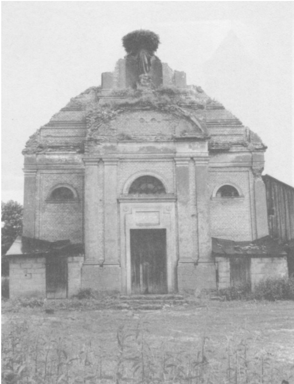
Figuur 15: Een recente foto van een kerk in Volhynië die in 1943 door de UPA gedeeltelijk vernield werd en na 1945 als magazijn werd gebruikt.

Zo hoopten ze de oprichting van een eigen soevereine staat te verzekeren. Mykola Lebed', afgetreden leider van de OUN-r, schreef in 1946: "De UPA trachtte Polen te betrekken bij een gemeenschappelijke strijd tegen Duitsers en bolsjevisten. Wanneer dat onsuccesvol bleek te zijn, gaf de UPA de Poolse