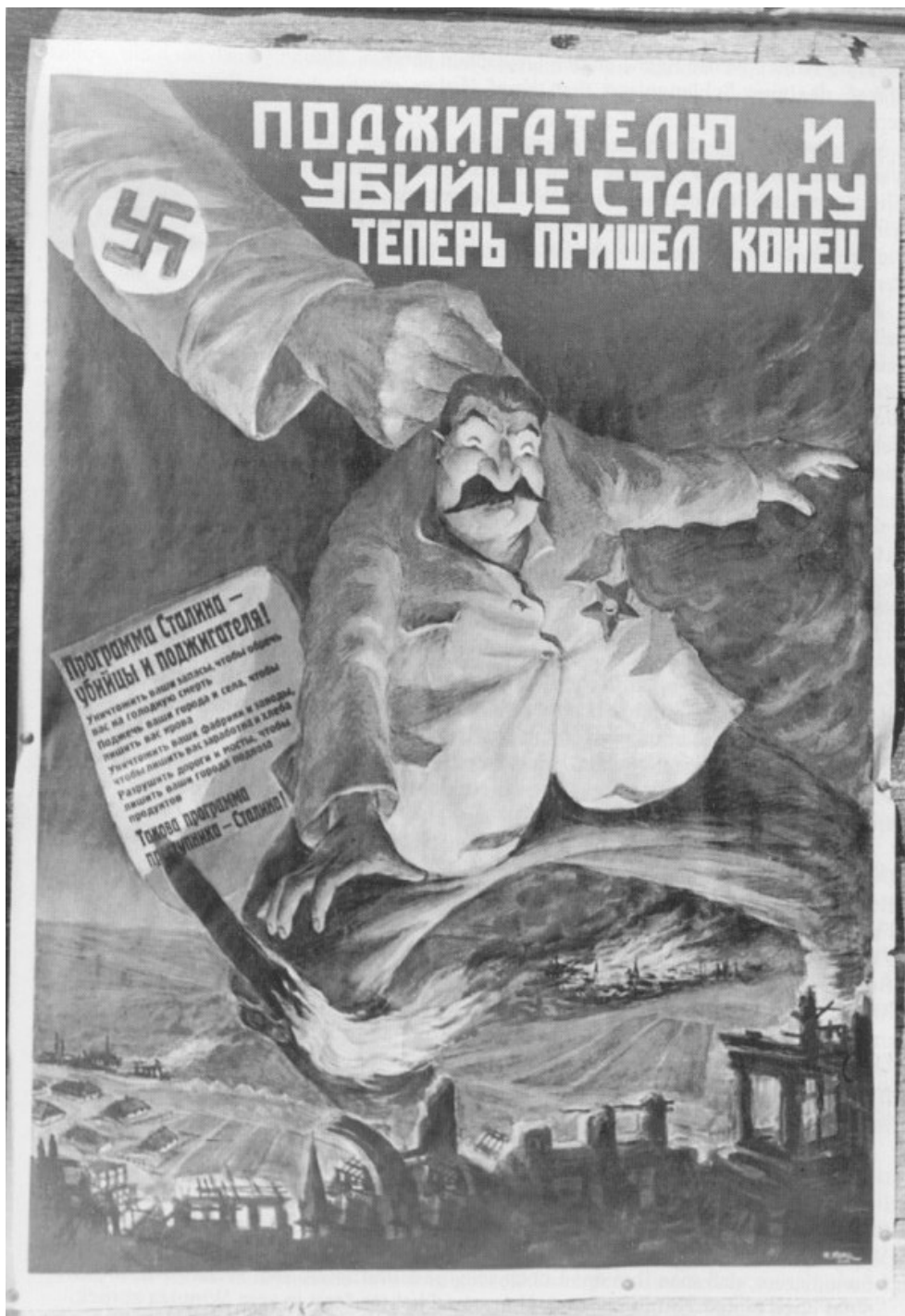
Figuur 9: Een Duitse propaganda-affice in 1941: “Nu is het einde gekomen aan de brandstichter en moordenaar Stalin”