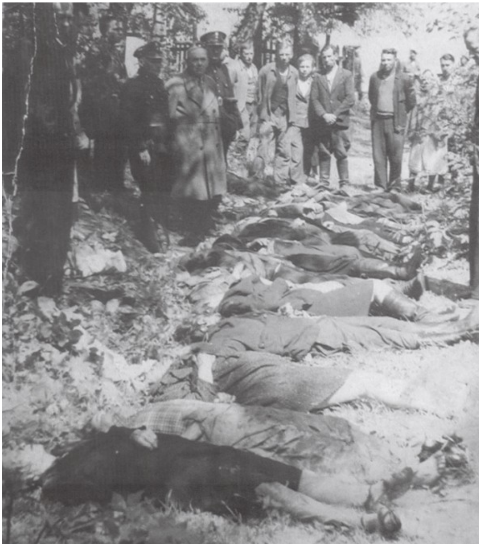
Figuur 19: Poolse slachtoffers van een aanval van de UPA (juni 1944)