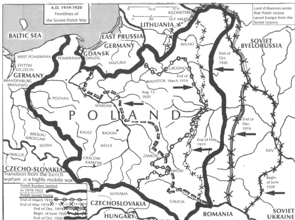
Figuur 2: De Pools-bolsjevistische oorlog (1919-1920)