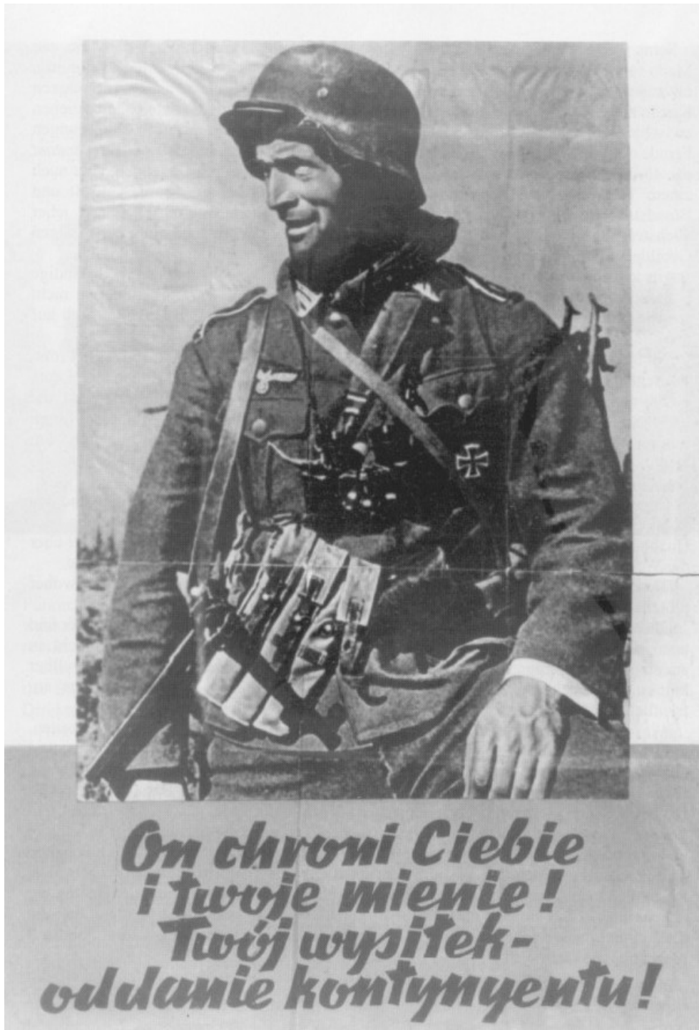
Figuur 12: Ook Polen dienden voor de Duitsers te werken. “Hij beschermt jou en je bezittingen! Jouw inspanning – levensmiddelen afstaan!”