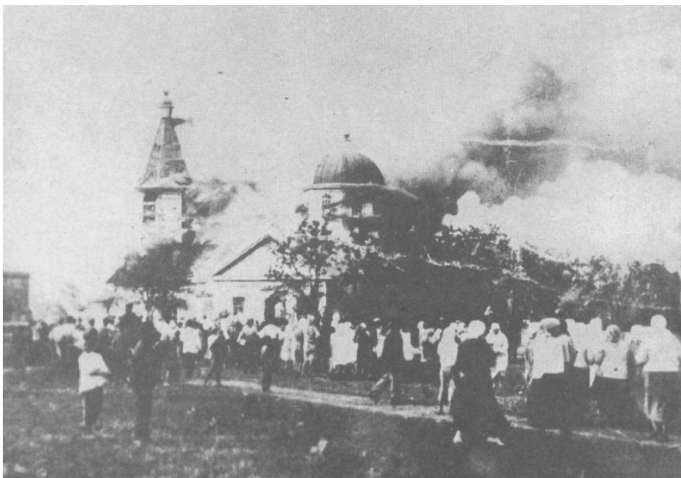
Figuur 5: Een brandende kerk in het district Tomaszów in 1937 of 1938

gedwongen verhuizingen van de orthodoxe bevolking. Grond werd verdeeld ten voordele van Poolse kolonisten. De belangrijkste manier van polonisatie was echter de katholisering van de orthodoxe Kerk door het vernielen, afbreken of omvormen van orthodoxe kerkgebouwen en het bedreigen en afpersen van orthodox-gelovigen. De ontmanteling betrof deels echter reeds vroeger in onbruik geraakte kerken die thans als schijnparochies fungeerden. Zo hoopte de metropoliet zijn uitgangspositie in onderhandelingen met de staat te versterken. Maar ook liturgische voorwerpen werden vernield.