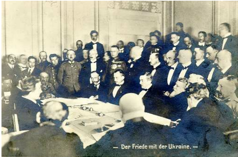
Figuur 1: De Centrale Mogendheden en de Oekraïense Volksrepubliek sluiten een vredesverdrag in Brest-Litovsk op 8 februari 1918

De Duitse inmenging in interne aangelegenheden veroorzaakte conflicten waarop de Duitse 'bondgenoot' op 29 april 1918 een nieuwe antisocialistische regering installeerde onder leiding van hetman Pavlo Skoropads'kyj, een ex-legerofficier van het tsaristische leger. 13 De liberale, progressieve maar inefficiënte en experimenterende Centrale Raad, waartegen onder grondbezitters protest was gerezen, werd afgeschaft en de officiële naam van de UNR werd veranderd in Oekraïense Staat. Het nieuwe bewind, dat in de historiografie bekend staat als het Hetmanaat, was conservatief en Russischgezind. Skoropads'kyj had nog ambitieuzere territoriale aanspraken. Hij wilde een constitutionele monarchie oprichten en Oekraïne integreren in een niet-bolsjevistische federatie met Rusland. Terwijl Oekraïne overspoeld werd door Russische politieke vluchtelingen, werd stabiliteit enkel verzekerd door Centrale bezettingstroepen. Maar hun aanwezigheid lokte het passieve en actieve verzet uit van misnoegde Oekraïense boeren en links radicaliserende arbeiders. Hierdoor kwamen de beloofde graanleveringen in het gedrang.