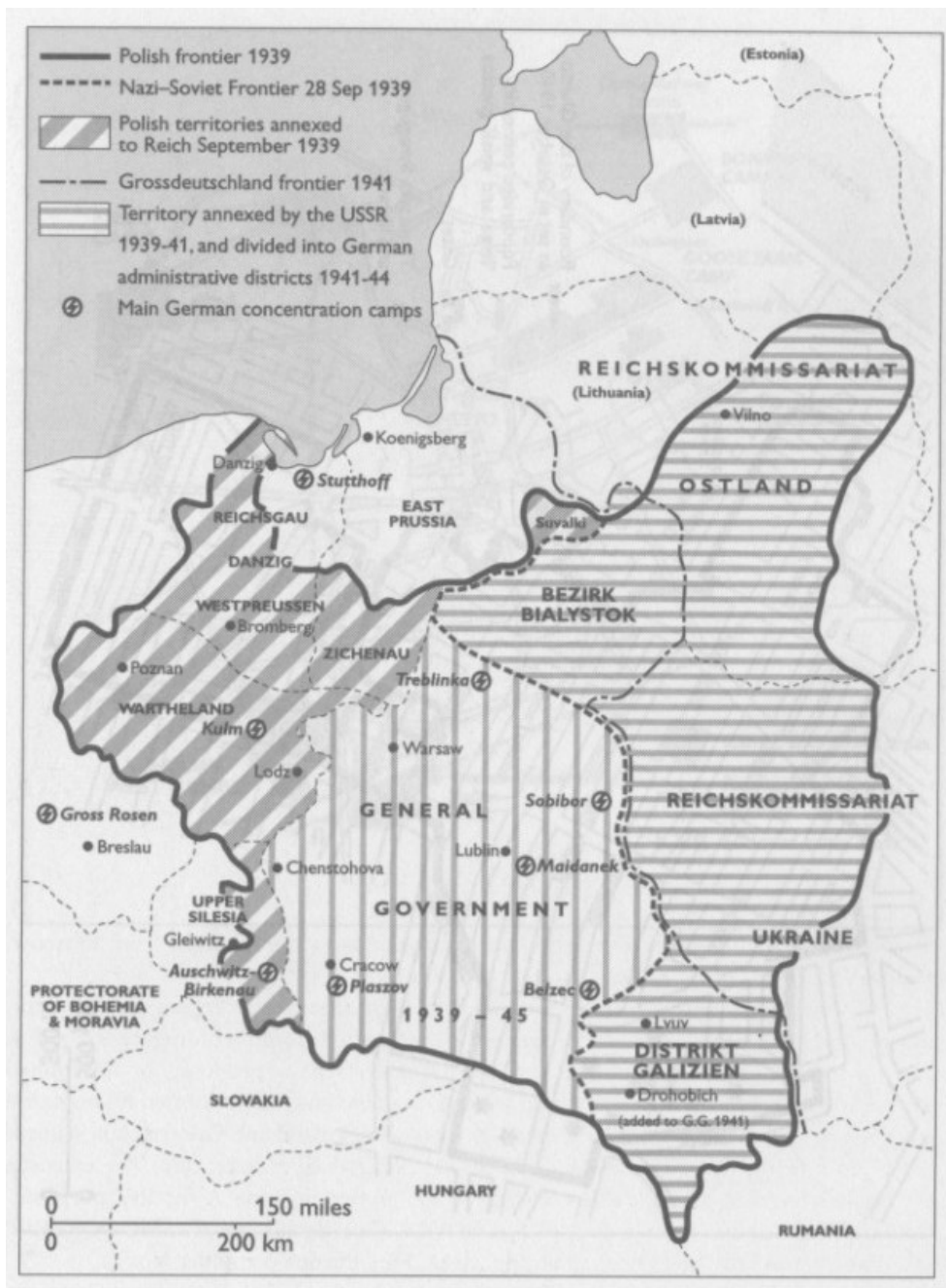
Figuur 8: Het Generalgouvernement en het Rijkskommissariaat

Frank breidde zijn strategie 'divide et impera' uit naar Oost-Galicië. Ook hier werden Oekraïners en Polen tegen elkaar uitgespeeld. Het doel was het verzet tegen de Duitse bezetter te verminderen; het ultieme doel was evenwel