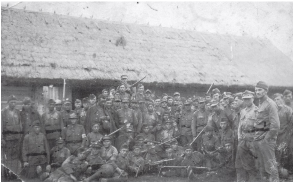
Figuur 6: Het 9 de infanteriedivisie, dat etnisch gemengd was. Wie kan Pool van Oekraïner onderscheiden?

Aanhangers van de nationalistische en communistische Oekraïense weerstand gebruikten de dienstplicht om enerzijds een kern van oppositie te vormen in het leger en nieuwe sympathisanten te lokken en om anderzijds zelf een professionele legeropleiding te volgen. Het Poolse opperbevel was zich echter bewust van het gevaar van een gebrekkige loyaliteit van niet-Polen in een potentiële oorlog. Oekraïense recruten werden daarom verspreid over Poolse afdelingen en hoofdzakelijk gestationeerd op etnisch Poolse gebieden. Bovendien probeerde het Poolse opperbevel de twee Oekraïense groepen (Volhynië en Polesië versus Oost-Galicië) gescheiden te houden. Oekraïners werden vooral ingedeeld bij de infanterie, cavalerie en artillerie met een numerus clausus of uitsluiting voor bepaalde afdelingen. Uit wantrouwen werden Oekraïners aanvankelijk niet toegelaten tot technische, maritieme, pantser- en luchtmachteenheden. In het officierenkorps waren Oekraïners zeer sterk ondervertegenwoordigd.