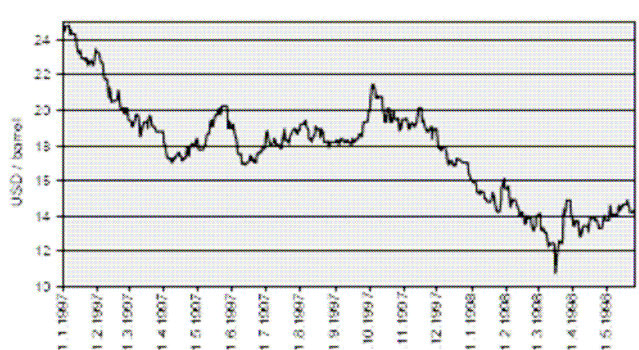
Grafiek 4.1. Prijs Brent crude oil per vat in 1997-1998 (USD)

De lonen mochten er dan wel op vooruitgegaan zijn de laatste jaren, ze bleven ver onder het niveau van 1991. Bovendien werd slechts veertig procent volledig en tijdig uitbetaald. Men had dan wel veel in het werk gesteld om buitenlandse investeringen mogelijk te maken, maar die bleven, gerekend per capita, eerder laag. De monopolies bleven machtig en de discussies in de door communisten gedomineerde Duma omtrent hun werking, laiden hoog op en verliepen uiterst moeilijk. De verbeterde kredietwaardigheid had op haar beurt eveneens negatieve gevolgen. Russische commerciële banken gingen, nu dat goedkoper was geworden, meer lenen bij Westerse financiële ondernemingen, waardoor die buitenlandse verplichtingen en de daaruit voortvloeiende druk op de Russische banken snel groeide, met als gevolg dat een mogelijke monetaire crisis wel eens fataal zou kunnen zijn. Ook zaken zoals de op de schulden drukkende interestbetalingen die een groot deel van het budget besloegen, waardoor er gesnoeid moest worden op andere zaken, en de olieprijzen die eind 1997 daalden (zie grafiek 4.1), klonken evenmin hoopgevend. Daarnaast kende Rusland ook problemen met zijn belastingsinning, die zeer moeizaam verliep door het verdeelsysteem dat tussen de regionale en federale overheid bestond, waarbij de eerste tegen betaling firma's delen van hun belastbaar inkomen hielp verbergen, met als gevolg dat de tekorten in de publieke sector zich opstapelden. (Op. cit.: 11)