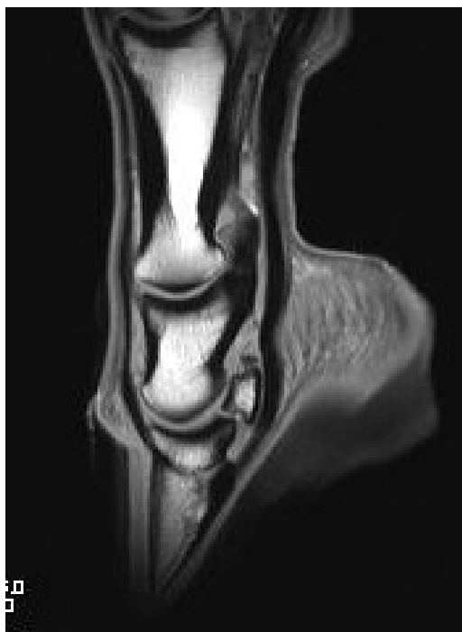
MRI veeld van de gezonde paardenvoet.