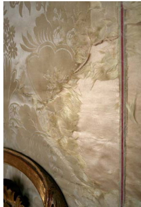
Figuur 24 Sporen van degradatie op wandbespanning

Het representatieve aspect van het paleis wordt bij het behandelen niet behouden. Het meubilair wordt behouden als historische bron.