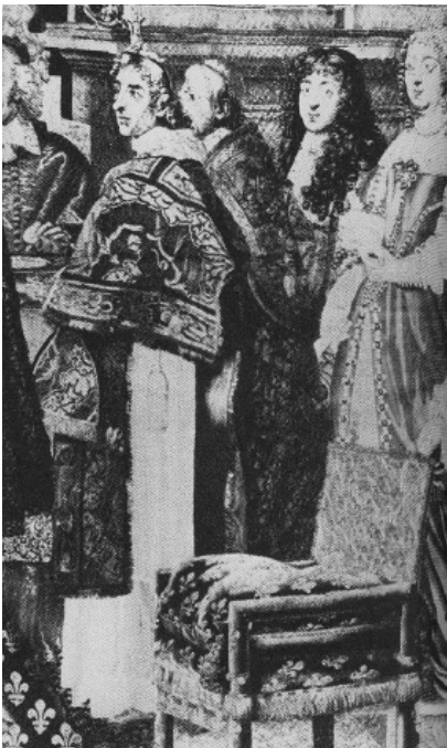
Figuur 10 Troon van koning Lodewijk XIV

Anders dan Lodewijk XIII was Lodewijk XIV een vorst wiens persoonlijkheid zich