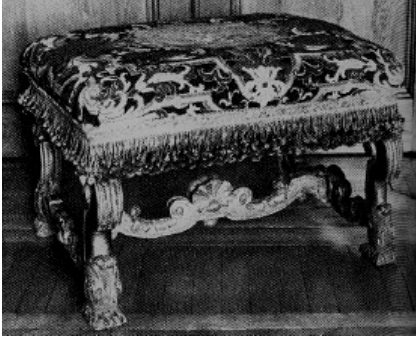
Figuur 9 taboeret

versierd met stoffen met de lelie of fleur de lis . (zie figuur 10)