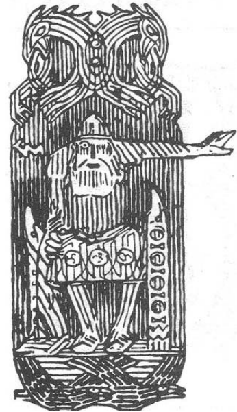
Figuur 1 Odin op de Hildskjalf, Noorse mythologische troon

Een voorbeeld hiervan is de zittende moedergodin van Catal Hüyük. Deze figuur werd gedateerd tussen het 7 e en 5 e millennium voor Chr. Het afbeelden van goden op een troon of zetel komt ook in talrijke andere culturen voor.