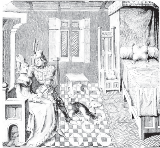
Figuur 6 14e eeuwse woonkamer met bank en chaire

De hoge rechtelijke heer had boven zijn stoel een baldakijn om zijn waardigheid en macht te tonen. Op de harde zitting lag ook soms een kussen van fluweel 10 .