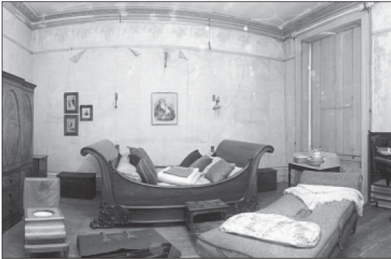
Figuur 16 kamer behouden zoals ze werd gevonden, bemerk het behangpapier

net zoals de wandbespanningen overspannen met een nylon tule 146 . Losschilferende polychromie werd ook gefixeerd. Blank hout werd afgewerkt met een lichte waslaag.