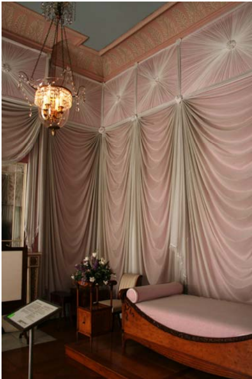
Figuur 23 Nieuw gestoffeerde kamer

Dit verschil geeft een duidelijk, en dus eerlijk, beeld van wat er nieuw is. Dit groot verschil in uitzicht kan het begrijpen van de context ook wel in de weg staan. Een leek zal de eenheid van het meubilair en de kamer misschien minder snel verstaan door dit verschil in uitzicht.