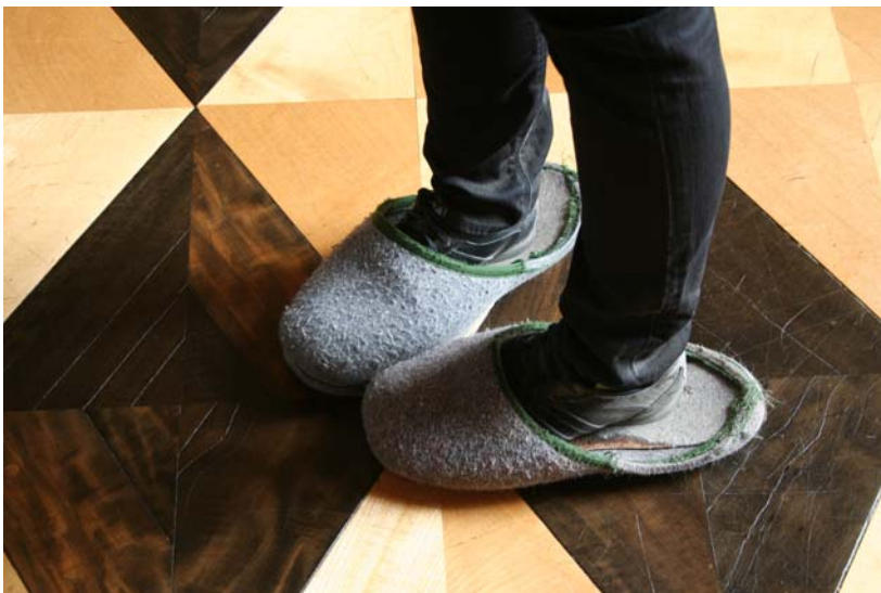
Figuur 25 Pantoffels ter bescherming van de historische vloer