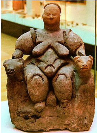
Figuur 2 Moedergodin Catal Hüyük

Het gebruik van zitmeubilair om de sociale status van een persoon te tonen komt al voor bij de eerste beschavingen. Ook goden worden in verschillende bevolkingsgroepen afgebeeld op een troon.