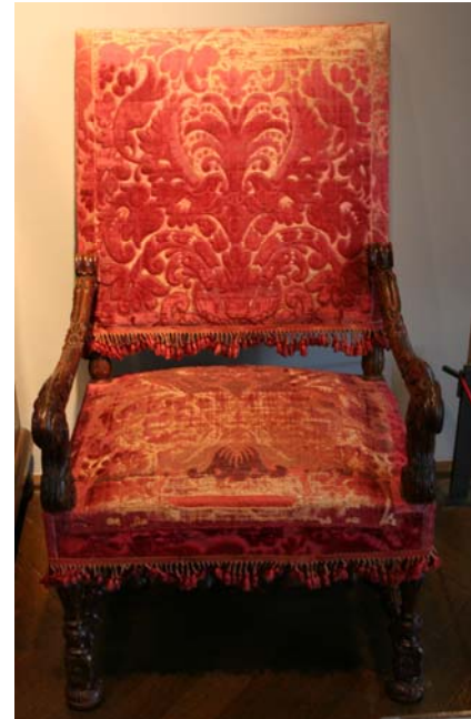
Figuur 22 Zetel uit Musée des Arts Décoratifs, behoud van degradatiesporen

Het behoud van oorspronkelijke elementen van een meubel als historisch document wordt niet op het meubel zelf gedaan, maar worden passief in een depot bewaard, zoals reeds gesteld in hoofdstuk 3.2.