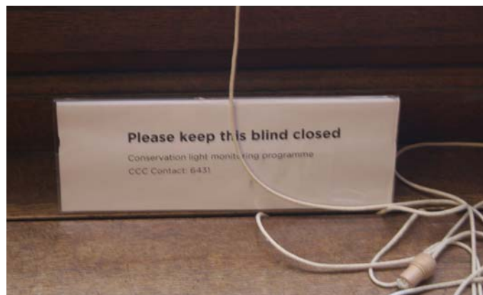
Figuur 17 'Please keep this blind closed Conservation light monitoring programme',

bepaalde meting uitvoert, zoals het meten van stof, UV en temperatuur, wordt er hierover ook geïnformeerd. Daarnaast werken de restauratoren soms ook in situ in het paleis, en kan het publiek deze ook aanspreken om een vraag te stellen.