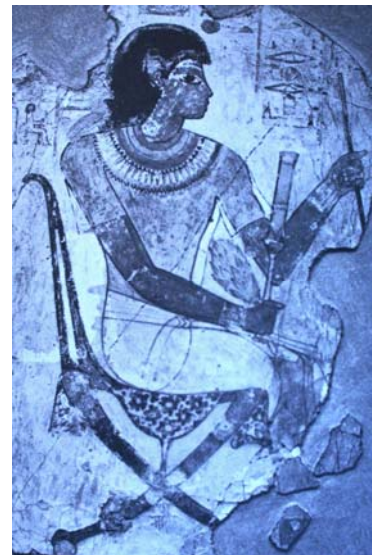
Figuur 3 Rijke burger op vouwstoel

De vouwstoel, die door de eeuwen heen werd gebruikt om iemands hoge status te duiden, ontstond in Egypte. Hij werd door commandanten in het veld gebruikt, en groeide