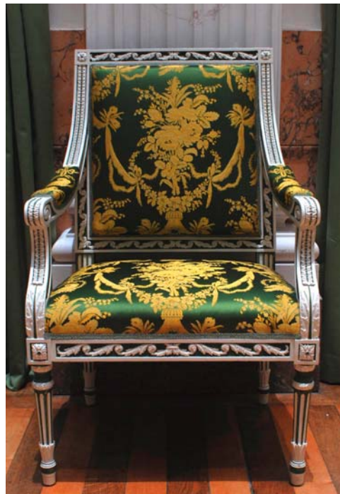
Figuur 26 Hergestoffeerd en gepolychromeerd meubel

De bestemming van het meubel in het interieur lag dus aan de grond van welke behandeling dit kreeg. Bij de museale objecten werkte men meer terughoudend dan bij de gebruiksobjecten. Bij deze gebruiksobjecten is het functioneel gebruik en comfort een primaire eis. Ook de representatieve functie is een factor bij de behandeling. Het meubilair staat in een gebouw dat dienst doet als zetel van de overheid, en vervult dus nog steeds zijn functie aldaar. Doordat het gebouw deze overheidsfunctie heeft, was de factor van het representatieve uiterlijk van