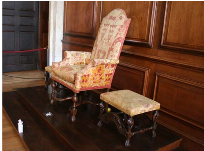
Figuur 18 bekleding met sporen van degradatie

Op het meubilair zijn deze sporen wel nog te zien in bijvoorbeeld de bekleding van een stoel. Deze bekleding wordt niet automatisch vervangen door een kopie, maar wordt geconserveerd op het meubel. Op sommige meubels werd wel een nieuwe bekleding aangebracht.