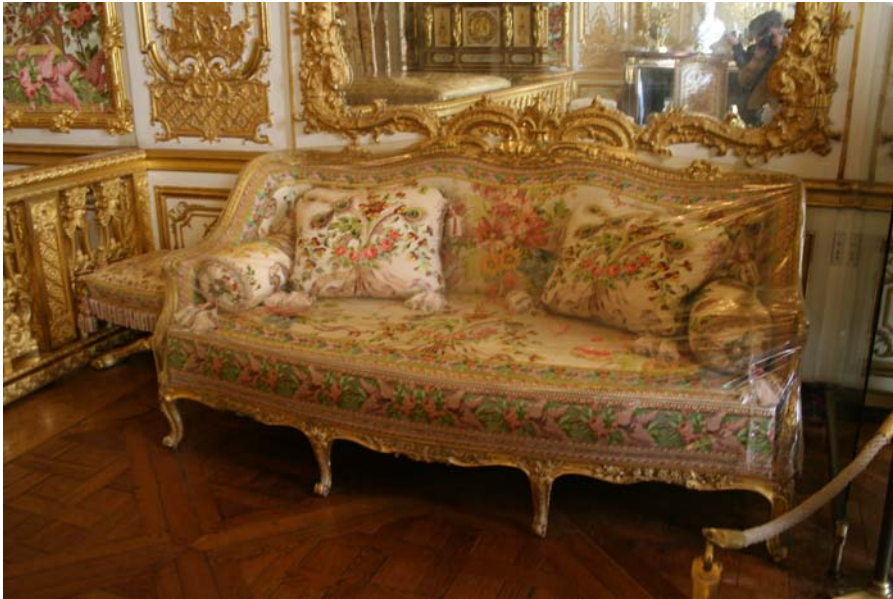
Figuur 21 Sofa uit de slaapkamer van de Koningin

Het aspect conservering waar in Hampton Court een grote nadruk werd op gelegd, is iets dat in Versailles niet te zien is. Niet alle ramen zijn voorzien van blinden, of UV werende folie. Ook komt men in Le Grand Trianon direct van de historische ruimtes uit een buitenruimte. Deze opeenvolging is inderdaad een deel van het ontwerp, en men kan zo het meer open wonen begrijpen. De invloed hiervan op de collectie is natuurlijk minder positief.