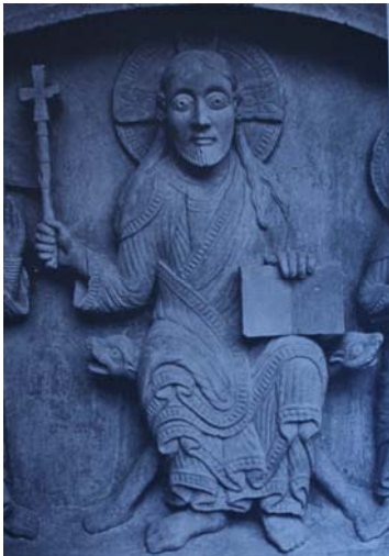
Figuur 7 Jezus op een faldistorium

Op tekeningen worden ook vaak personen op een faldistorium , vouwstoel, of op een chaire , met een kussen onder hun voeten afgebeeld. Op deze afbeeldingen zijn vaak ook God, Christus of een van de Evangelisten afgebeeld, soms met een voetbankje of kussen 11 . De faldistorium was ook populair bij de aristocratie door de draagbaarheid ervan.