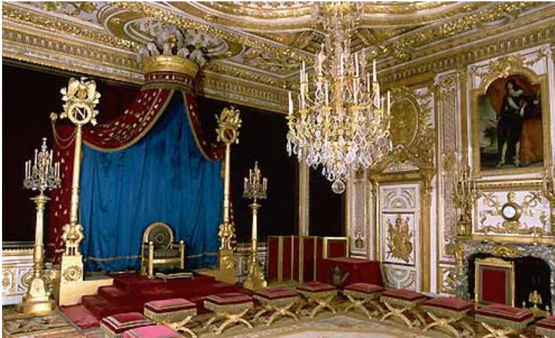
Figuur 13 Troonzaal in Fontainebleau, verguld meubilair met verguld fluweel

De meubels moesten de macht van Napoleon weergeven en het verband leggen tussen de twee grootse oude rijken en het nieuwe Keizerrijk Frankrijk. Het combineert de luxe van het Frankrijk voor de revolutie met de grandeur van het antieke Rome en Egypte 36 . De Empire stijl, met zijn indrukwekkende interieurs en meubels werden dus gebruikt als propaganda om het Keizerrijk in zijn grootsheid te tonen. De symbolen van het Keizerrijk waren de gouden N met laurierkransen, bijen en de Romeinse adelaar. Deze symbolen komen ook terug in het textiel, zowel op de zitmeubels als het andere interieurtextiel. De stoffen die werden gebruikt zijn zijde damast met ingeweven patronen, en fluwelen. De hofarchitecten Fontaine en Percier ontworpen de interieurs als totaalwerk, waarin de glorie van het Keizerrijk Frankrijk werd getoond 37 .