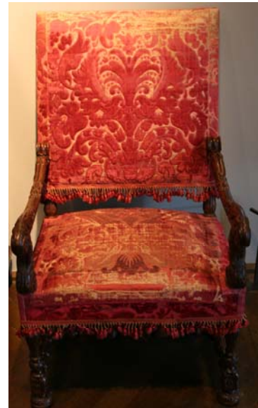
Figuur 8 Armstoel met gefigureerd fluweel

In de 17 e eeuw ontstaat er door de grote welvaart en grotere vraag naar comfortabel en luxueus meubilair. De tapisiers beginnen een grotere rol te spelen. Er worden verschillende nieuwe soorten luxueuze stoffen gebruikt, zoals fluweel van Genua met vergulde grond, verguld brokaat en lampas 15 . Door de hoge kostprijs van deze kostelijke stoffen, was een gestoffeerde stoel heel erg duur. Het was een waar symbool van rijkdom en status. In de Nederlanden werden bijvoorbeeld oosterse tapijten over een tafel gelegd. Dit 'Turksch Kleed' was het nieuwe statussymbool 16 .