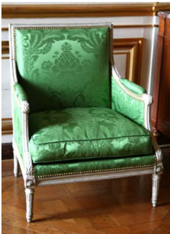
Figuur 14 gepolychromeerde armleunstoel met zijden damast

De meubels moesten de macht van Napoleon weergeven en het verband leggen tussen de twee grootse oude rijken en het nieuwe Keizerrijk Frankrijk. Het combineert de luxe van het Frankrijk voor de revolutie met de grandeur van het antieke Rome en Egypte 36 . De Empire stijl, met zijn indrukwekkende interieurs en meubels werden dus gebruikt als propaganda om het Keizerrijk in zijn grootsheid te tonen. De symbolen van het Keizerrijk waren de gouden N met laurierkransen, bijen en de Romeinse adelaar. Deze symbolen komen ook terug in het textiel, zowel op de zitmeubels als het andere interieurtextiel. De stoffen die werden gebruikt zijn zijde damast met ingeweven patronen, en fluwelen. De hofarchitecten Fontaine en Percier ontworpen de interieurs als totaalwerk, waarin de glorie van het Keizerrijk Frankrijk werd getoond 37 .