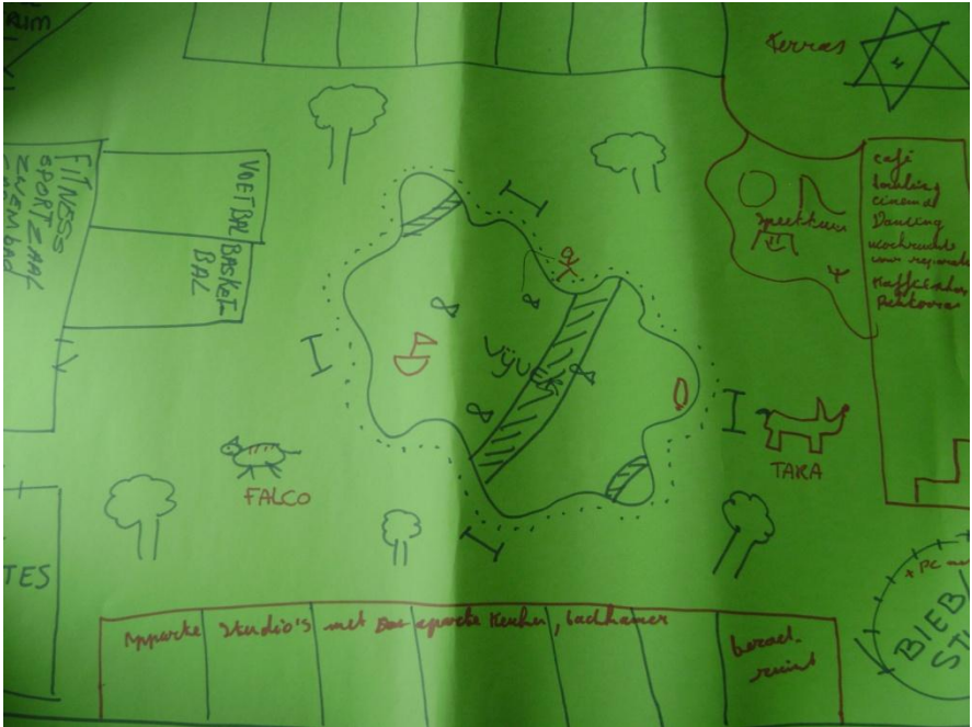
Plattegrond gemaakt door gedetineerden Leuven Centraal (geheel nieuw concept)