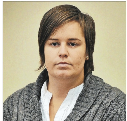
Het Belang van Limburg , 13/10/10, p. 1