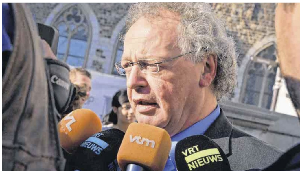
Het Nieuwsblad , 13/10/10, p. 7 (© blg)