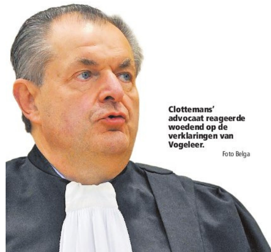
Het Belang van Limburg , 13/10/10, p. 2