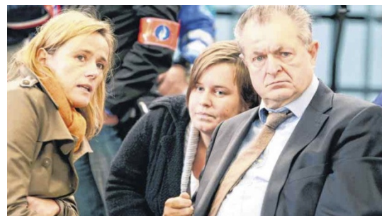
Het Nieuwsblad , 1/10/10, p. 7 (© pn)