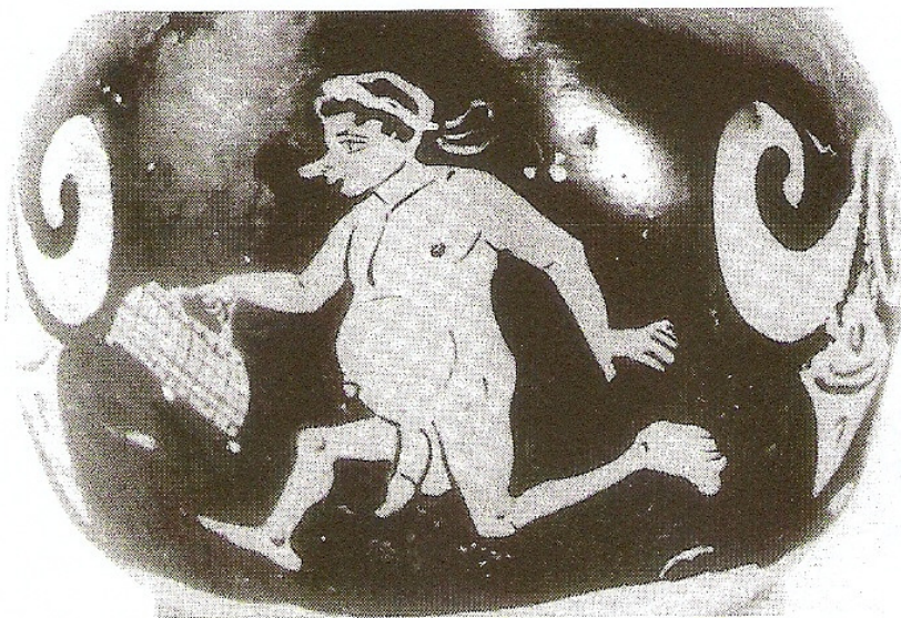
Figuur 2: Askos, Basel, Antikenmuseum, Z 303