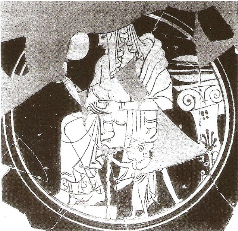
Figuur 13 : Fragment van beker, Athene, Agora Museum, P 2574