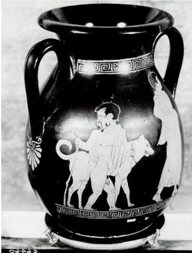
Figuur 10: Pelike, Boston, MFA, 76.45