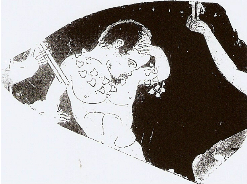
Figuur 6 : Fragment van Stamnos, Erlangen, Universiteitsbezit, 1707