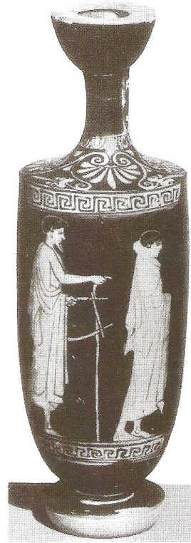
Figuur 14 + 15: Fragment van beker, Ferrara, Museo Nazionale, 20363 + Lekythos, New York, Parke- Bernet Galleries