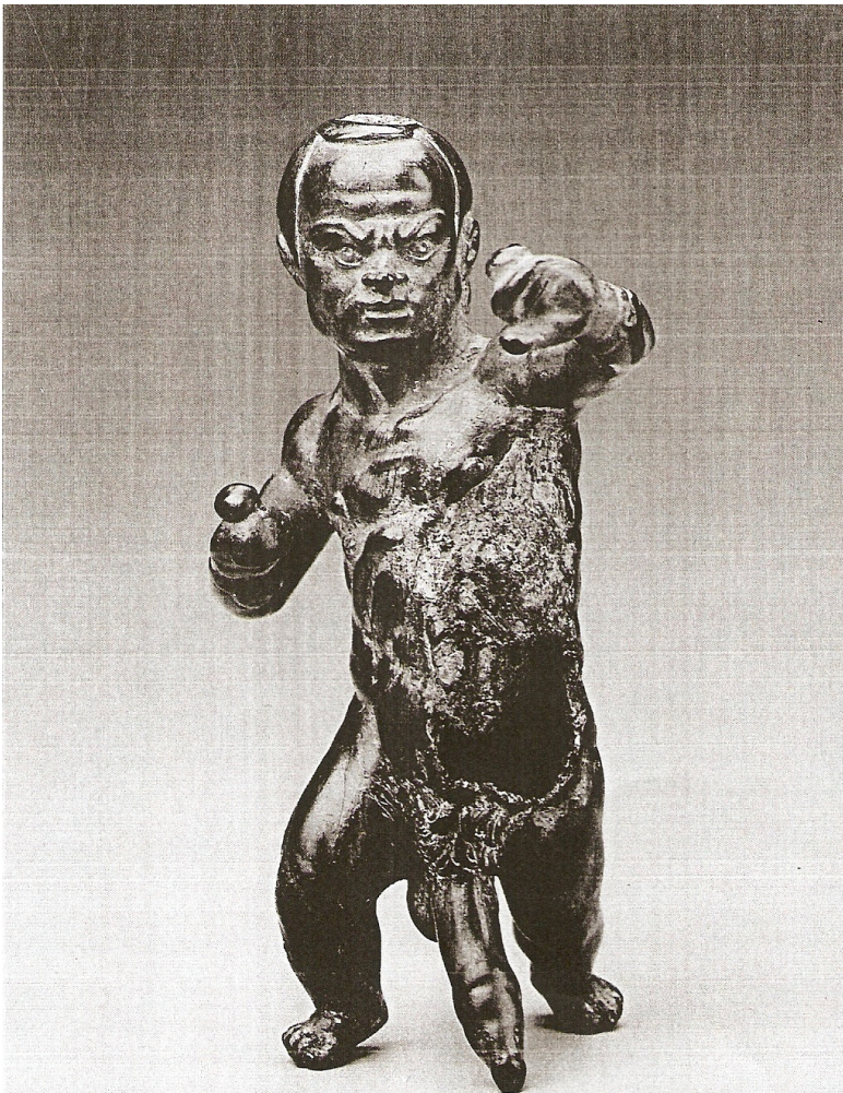
Figuur 18: Bronzen figurine, Boston, Museum of fine arts, Res. 08.32K