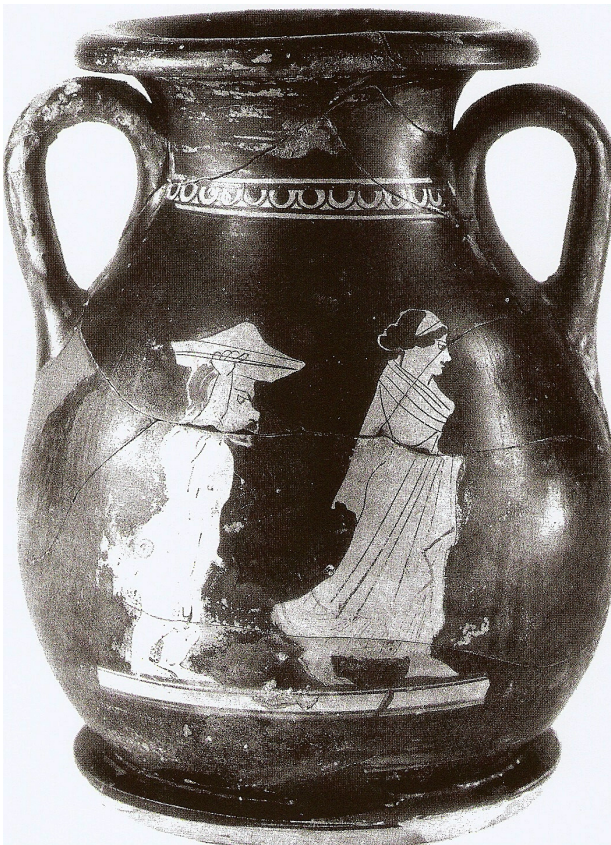
Figuur 16: Pelike, Agrigento, Museo Civico, ex Giudice 638