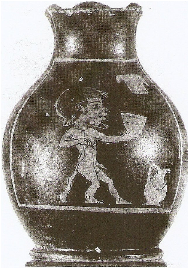
Figuur 1: Choes, Dresden, Albertinum, ZV 1827