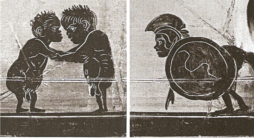
Figuur 17: Beker, Berlijn, Altes Museum, S.121