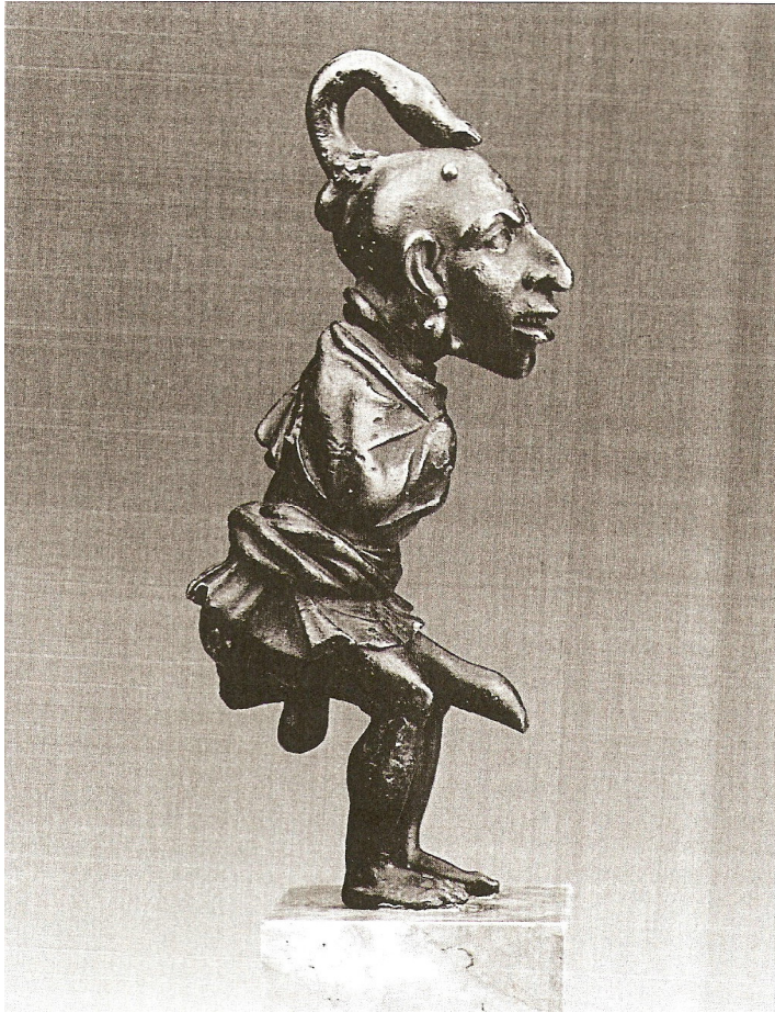
Figuur 3: Bronzen figurine, Boston, Museum of fine arts, 08.32D