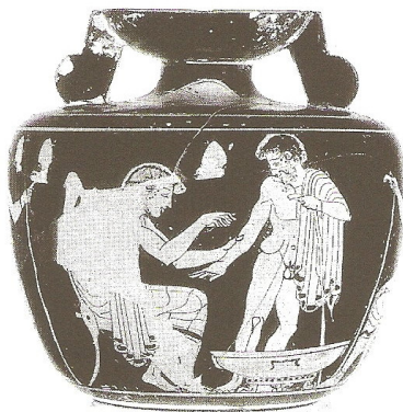
Figuur 11: Aryballos, Parijs, Louvre, CA 2183