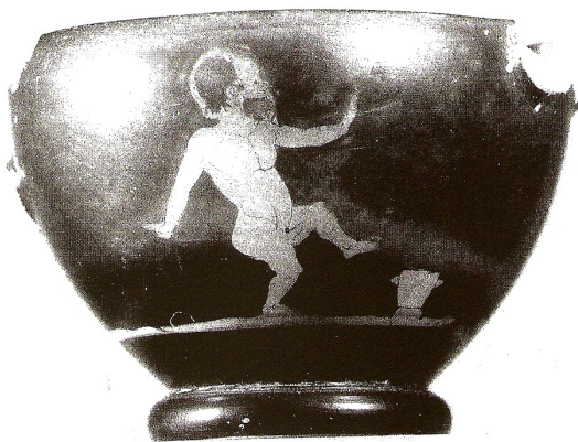
Figuur 9: Skyphos, Yale, Universiteitscollectie, R. Darlington Stoddart collectie, 160