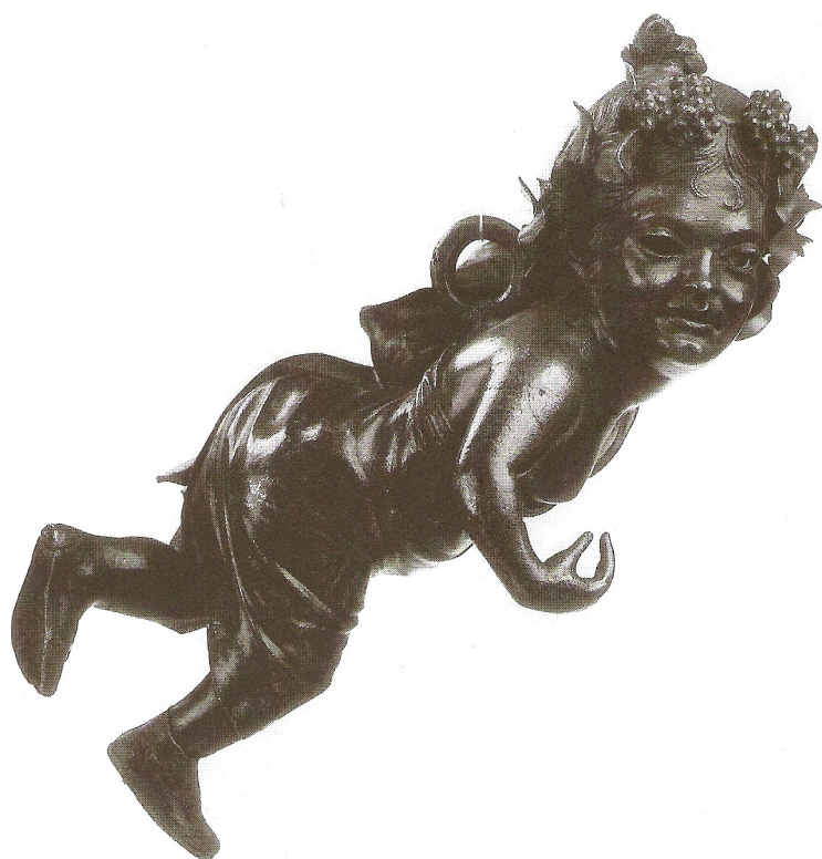
Figuur 19: Bronzen figurine, Tunis, Musée du Bardo, F 214