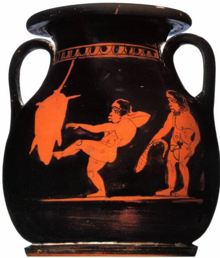
Figuur 8 : Pelike, St. Petersburg, Hermitage Museum, b 1621