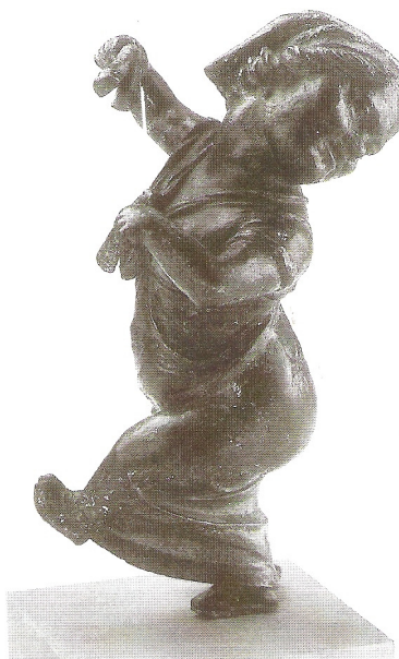
Figuur 4 + Figuur 5: Bronzen figurines, Tunis, Musée du Bardo, F215 + F213