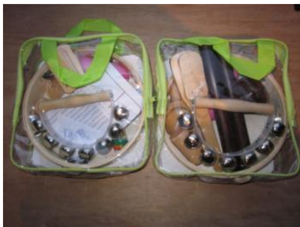
Zak met muziekinstrumenten 1 en 2