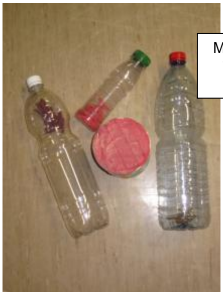
Muziekinstrumenten van gerecycleerd materiaal