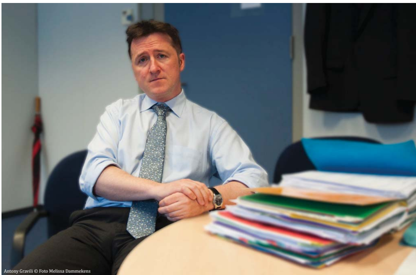
Antony Gravili

GRAVILI: “Eerst en vooral: we praten met iedereen. Dat moet volgens de wet. Dat betekent niet dat iedereen krijgt wat hij of zij wil. Ik denk eerder dat sommige critici vooral