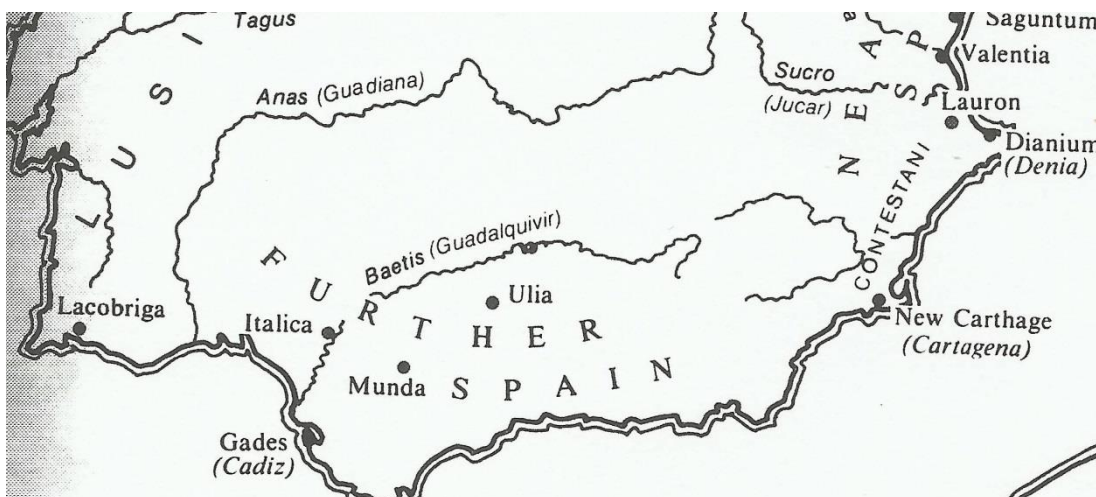
Uit: Greenhalgh P., Pompey: the Republican Prince , z.p.