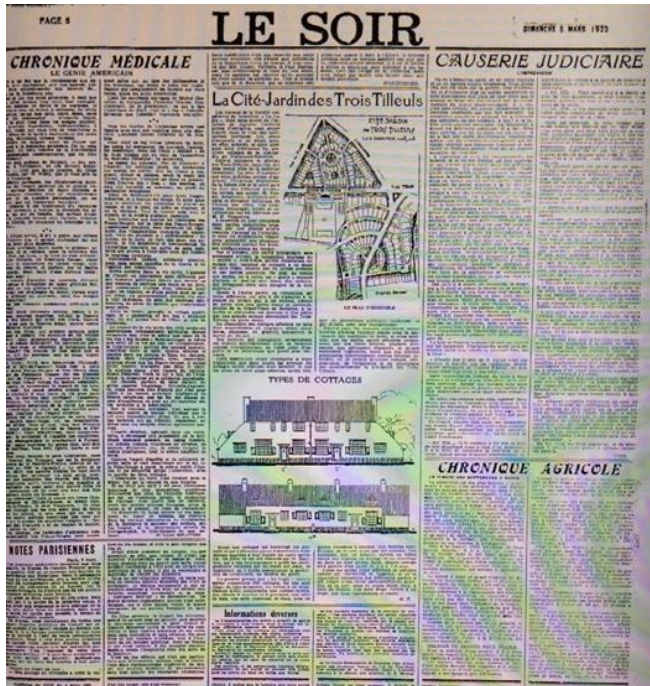
[2] Links: Le Soir , 5 maart 1922, 5.