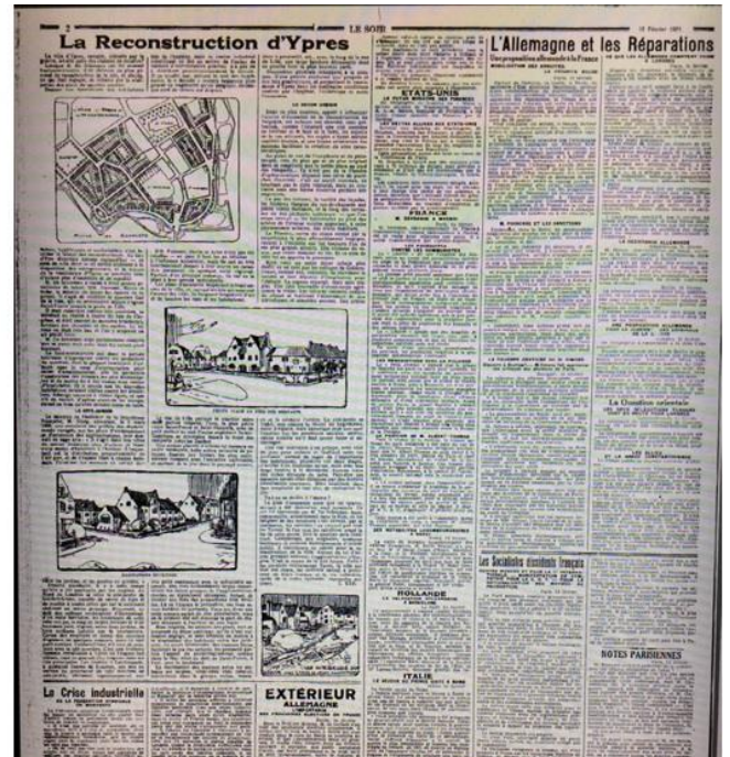
Rechts: Le Soir , 15 februari 1921, 2.