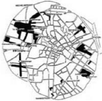
Situering van arbeiderswoningen in de binnenstad