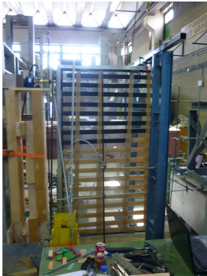
Figuur 2: testopstelling kader met glasvulling