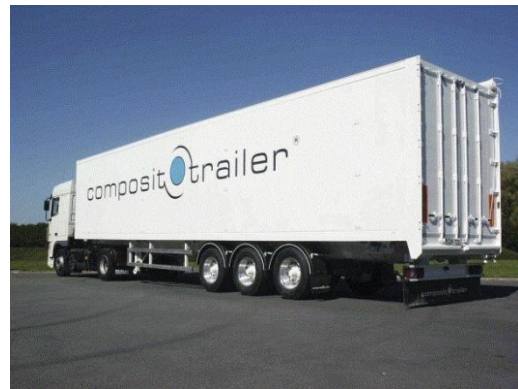
Figuur 1: voorstelling van een gestikt sandwichpaneel waarbij twee sterke huiden aan een kern worden gestikt (links) en de oplegger bestaande uit sandwichpanelen gebouwd door Acrosoma (rechts).