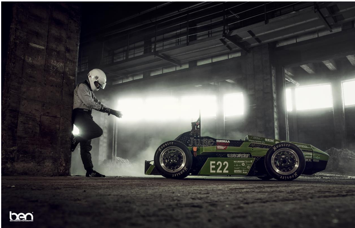
Figuur 1. Racewagen June ontworpen door Formula Group T, 2013-2014