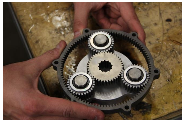
Figuur 3. Tandwielen in planetaire configuratie