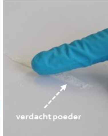
Dipbemonstering van het verdachte poeder op de elektroden.