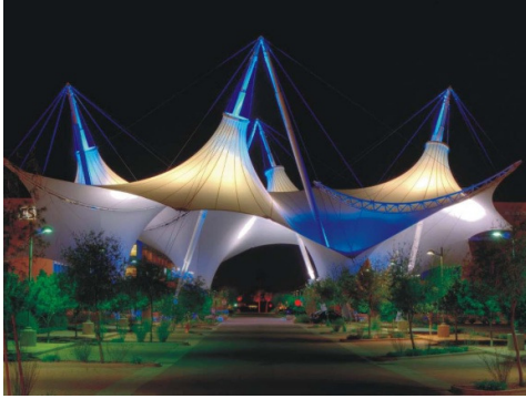
Membranarchitectuur als spektakel voor het oog