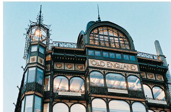
Het Muziekinstrumentenmuseum, een iconisch gebouw in de Brusselse binnenstad. Van de extravagante Art Nouveau stijl wordt echter bitter weinig melding gemaakt

onteren. Wanneer men vanuit toeristische invalshoek de woorden "erfgoed" en "toerisme" in de mond durft te nemen, schreeuwen sceptici al gauw moord en brand. Toch kan het anders. Het integreren van een toeristische dimensie binnen het waardevolle patrimonium hoeft immers niet steevast te leiden tot doemscenario's à la Venetië.