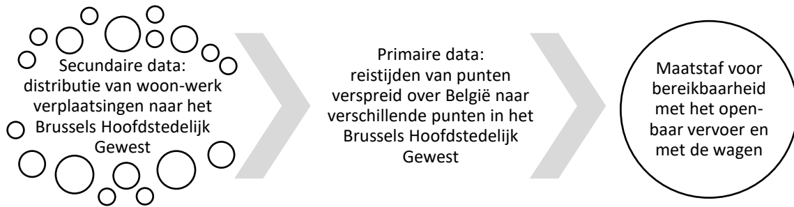
Figuur 1 Illustratie bij de methodologie