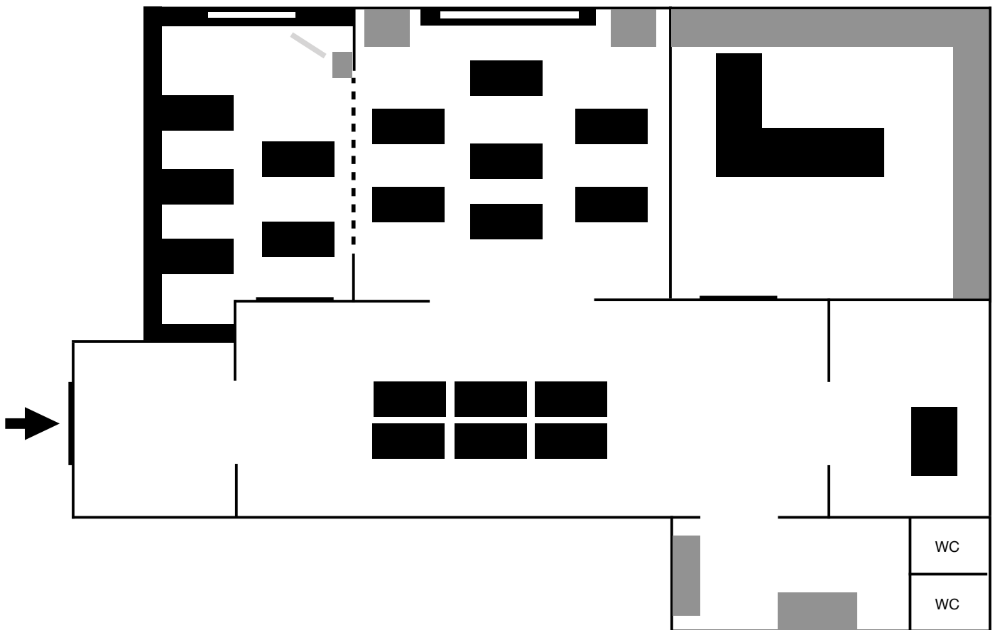
Figuur 2. Plattegrond Mangoboom in Bloei

boeken en dozen. De twee andere ruimtes zijn ruimtes die tijdens de pauze door de cursisten gebruikt worden. De deuren van deze twee ruimtes staan steeds open. In de ene ruimte is een koelkast te vinden en alles om thee of koffie te maken. Daarnaast staat er ook een tafel met computer op. In de andere ruimte is een lavabo en zijn de wc's. Er staat ook een kookfornuis, maar dat doet eerder dienst als tafel. Op het fornuis stond namelijk een amalgaam aan materiaal: enkele handdoeken, een kom een glazen schotel met fruit... In deze twee ruimtes wordt heel wat materiaal opgeslagen gaande van gezelschapsspelletjes tot een friteuse.