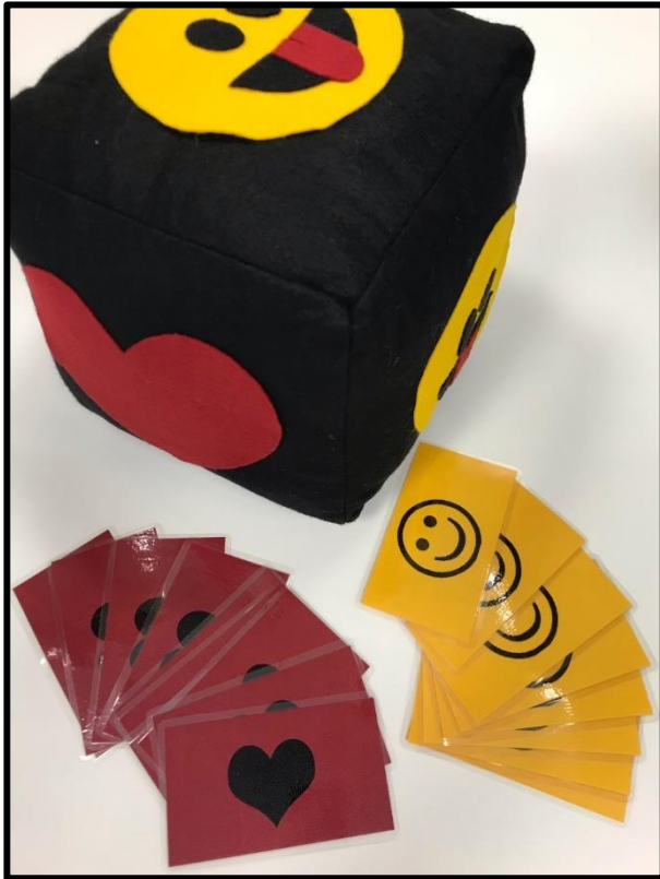
Emotie- en behoeftespel (vrije tijd & school)