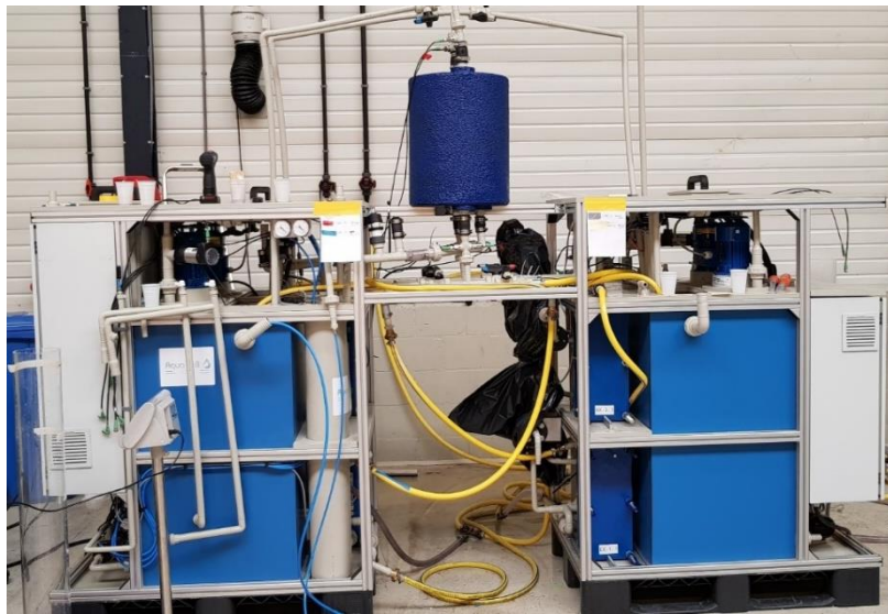
Figuur 2 Testopstelling voor het valideren van de module.