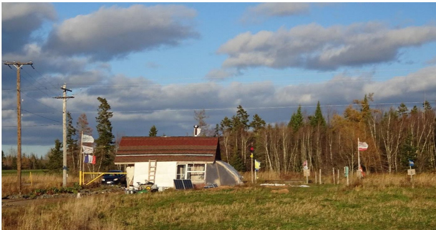
Nova Scotia, Canada: Het Treaty Truckhouse Against Alton Gas blokkeert de ingang naar de rivier. (Anton Vandevoorde, 11 november 2018)