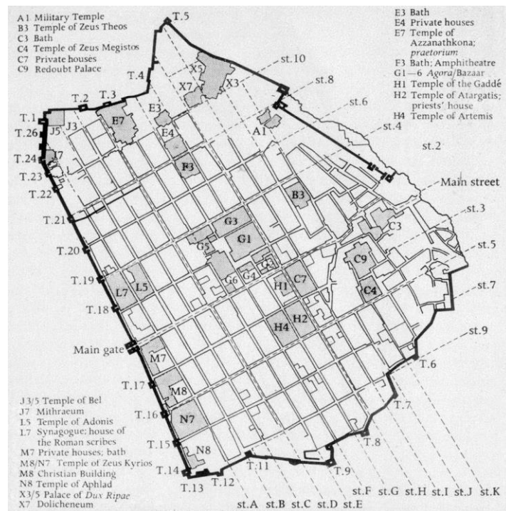
Fig. 1: Dura Europos

Tijdens de veldtocht van Lucius Verus in 164-165 tegen de Parthen veroverden de Romeinse troepen de Parthische stad aan de Eufraat, Dura Europos. Deze stad, gesticht door de Seleuciden, was een belangrijke grenspost tussen het Romeinse en Parthische Rijk. Een eenheid Palmyreense boogschutters in Romeinse dienst werd in de stad gekazerneerd. Onder de regering van Commodus werd ook de ruitereenheid cohors II Ulpia Paphlagonum Equitata in de stad geplaatst. 8 Met het hernemen van de vijandelijkheden tussen de Romeinen en de Parthen onder de Severi kreeg Dura een groter Romeins garnizoen. In het noordwesten van de stad werd een deel omgebouwd om voor militaire doeleinden te kunnen worden gebruikt, het zogenaamde militaire kamp of district. Een eenheid van Palmyreense soldaten werd er gevestigd, bestaande uit ruiters en voetvolk, de cohors XX Palmyrenorum . Van deze eenheid is een deel van het militaire archief bewaard gebleven, waardoor onze kennis erover redelijk groot is. Het cohort was een cohors milliaria dat bestond uit voetvolk, ruiters en zelfs enkele dromedarii. Ook enkele vexillationes van legioenen werden in de stad gelegerd. Het betrof eenheden van de legioenen IV Scythica , XVI Flavia Firma en III Cyrenaeca . Ook soldaten van