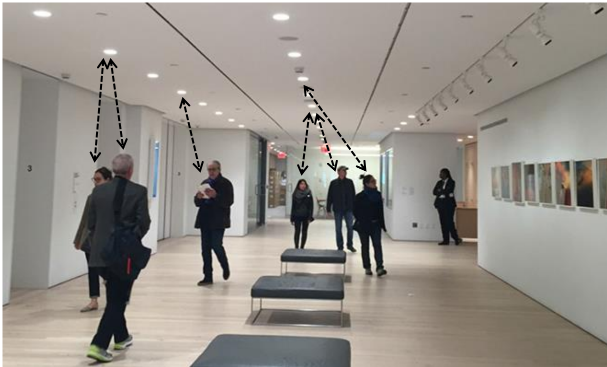
Figuur 2: visualisatie van LightTour. Bezoekers ontvangen audiodata van de dichtsbijzijnde LED-lamp.