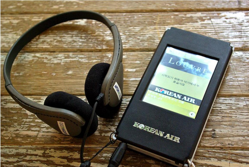
Figuur 1: voorbeeld van de bestaande audiogids van het Louvre in Parijs.