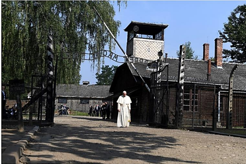
Plaatsen zijn getekend door hun verleden. Paus Franciscus bezoekt het concentratiekamp Auschwitz, 29 juli 2016.