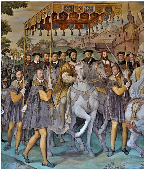
Frans I en Karel V bij de intrede in Parijs. Fresco van Taddeo Zuccaro – Palazzo Farnese.

De ontmoetingen tussen de Amerikaanse president Trump en de Noord-Koreaanse leider Kim Jong-un, de rondreizende Chinese president Xi Jinping, het voluntaristische buitenlandbeleid van de Franse president Macron, de theekransjes van de G7-werldleiders etc. De internationale politiek bukt van blitse bijeenkomsten. Toch staan ze niet garant voor de versterking van vriendschappelijke relaties. Het imago van de aanwezige staatshoofden is minstens even belangrijk. Historisch onderzoek naar de reis van Karel V door het land van aartsvijand Frans I toont aan dat dergelijke encensering van de macht van alle tijden is. Politieke beeldvorming van 500 jaar oud kan ons ook vandaag nog veel leren.