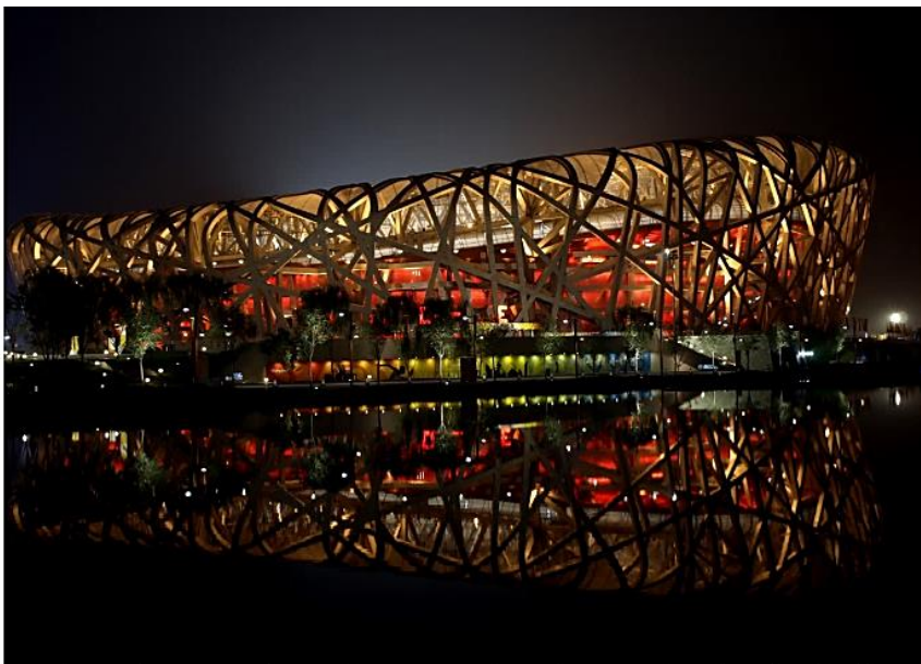
China's visitekaartje aan de wereld. Het Nationale Stadion van Peking (Vogelnest), gebouwd voor de Olympische Zomerspelen van 2008.

Militair konden de vorsten hun fortificaties etaleren. In Orléans had Frans op twee weken tijd 35.000 soldaten verzameld. De boodschap was duidelijk: Karel kon maar beter zijn beloftes nakomen, want hij was klaar voor een nieuwe oorlog. Het doet wat denken aan de beruchte uitspraak van George W. Bush: “Either you are with us, or you are with the terrorists.”