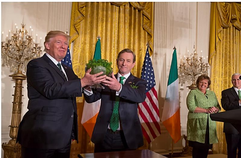
Geschenken bij staatsbezoeken worden niet willekeurig gekozen. Voormalig Iers premier Enda Kenny gaf Donald Trump een bokaal met klavers cadeau bij zijn bezoek, 16 maart 2017.

De geschenken in 1539-1540 waren talrijk: juwelen, jachtvogels, lakens, standbeelden, paarden etc. Rekeningen geven aan dat Karel zelfs een wagen van een overleden generaal cadeau deed aan Frans, die zelf minder goed ter been was. Frans kon zich zo tijdens de reis eenvoudig verplaatsen met een voertuig van een generaal die hem in het verleden had bekampt. De strijdbijl werd op die manier symbolisch begraven.