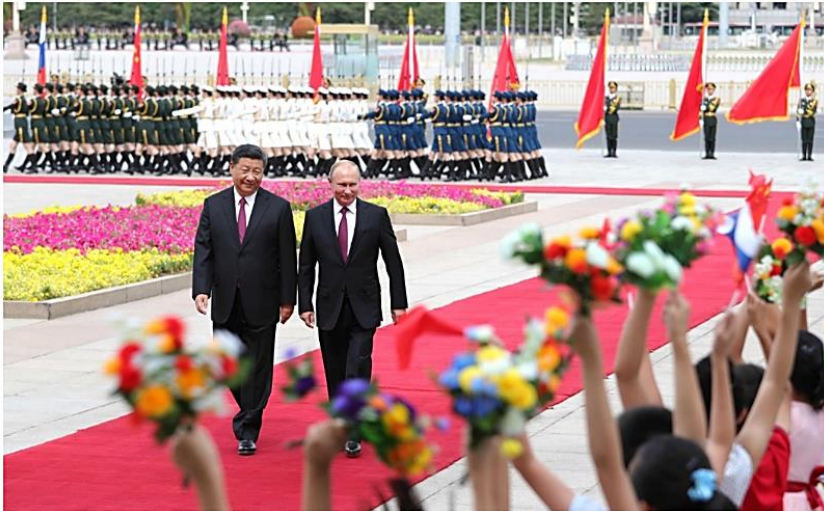
Officiële ceremonie met militaire parade naar aanleiding van het bezoek aan China van de Russische president Poetin, in aanwezigheid van president Xi Jinping.