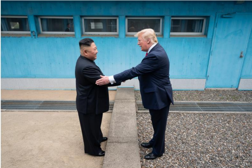
Wanneer het onmogelijke mogelijk wordt. De 'historische' ontmoeting tussen Donald Trump, president van de VS, en de Noord-Koreaanse leider Kim Jong-un aan de Koreaanse grens, 30 juni 2019.

De vorstelijke vete kende nu namelijk een omgekeerde dynamiek. De andere monarch was niet langer de baarlijke duivel, maar de gunsteling van extravagante vertrouwensclaims. Kronieken en brieven getuigen hoe Karel met een ongezien kleine delegatie afreisde naar Frankrijk. Zo betoonde hij zijn vertrouwen. Frans legde dan weer zijn koninkrijk volledig in handen van zijn voormalige gijzelnemer. Karel werd als koning van Frankrijk ontvangen. Beide vorsten wilden elkaar in deugden overtreffen. Ze wilden niet de aanstoker zijn van een volgende oorlog.